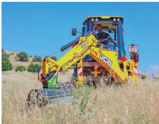
Esta máquina ofrece muchas posibilidades

zonas urbanas como rurales. La inversión realizada supera los 169.000 euros. Esta máquina incorpora un motor diésel de bajas emisiones, cabina climatizada, sistema GPS y equipo retroexcavador, además de varios aperos, como desbrozadoras, horquillas portapalés, martillo hidráulico percutor, hoja quitanieves y destocador-ahoyador, que la hacen más útil.