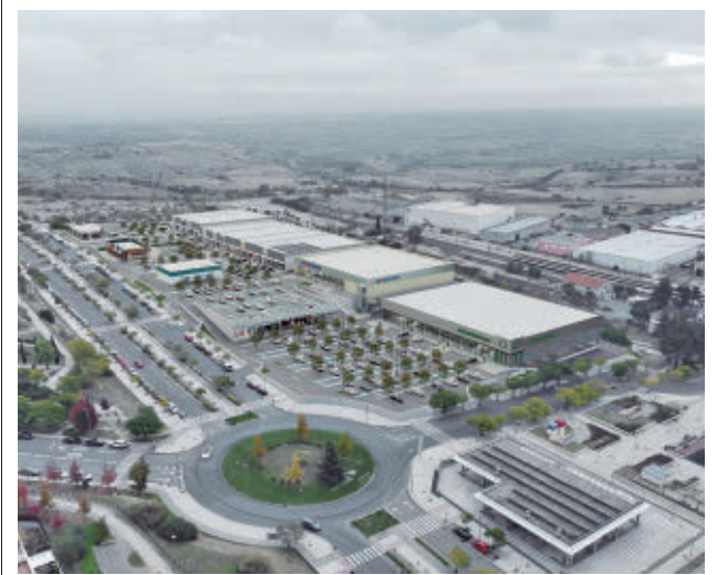
Así se espera que quede el proyecto