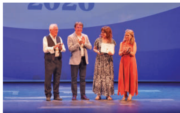
Inauguración en el Teatro del Centro Cultural Adolfo Suárez

La programación de las Jornadas del Mayor 2026