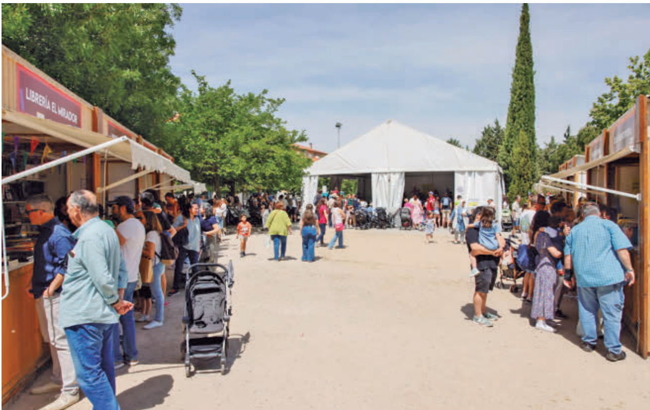
Imagen de la pasada edición AYUNTAMIENTO DE COLMENAR VIEJO