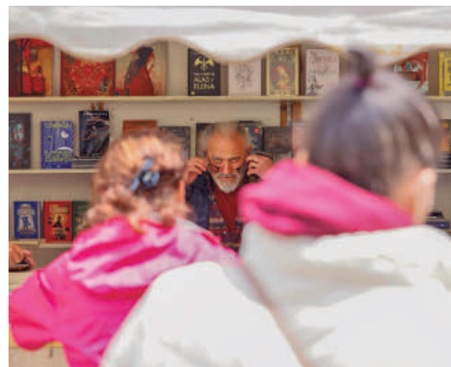
Firma de libros en ediciones anteriores AYTO DE COLMENAR VIEJO