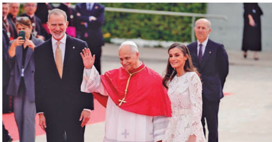
Recepción de Felipe VI y doña Letizia