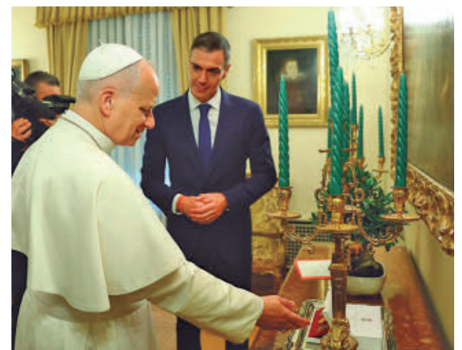
Reunión con Pedro Sánchez