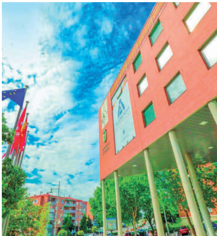
Ayuntamiento de Alcobendas

Para hacerlo más equitativo se han introducido tres tramos y, por tanto, tres categorías dentro del rango de 0 a 70 metros cuadrados. Este cambio pretende que los comercios más pequeños, que generan menos residuos, paguen