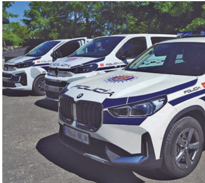
Los nuevos vehículos presentados

En la presentación de estos vehículos, desde el Ayuntamiento destacaron que se tra-