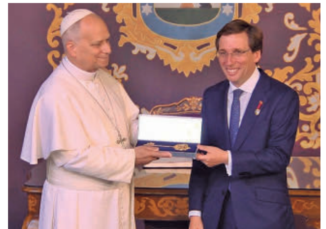
Entrega de la Llave de Oro de Madrid E.P.