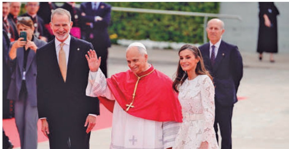
Recepción de Felipe VI y doña Letizia