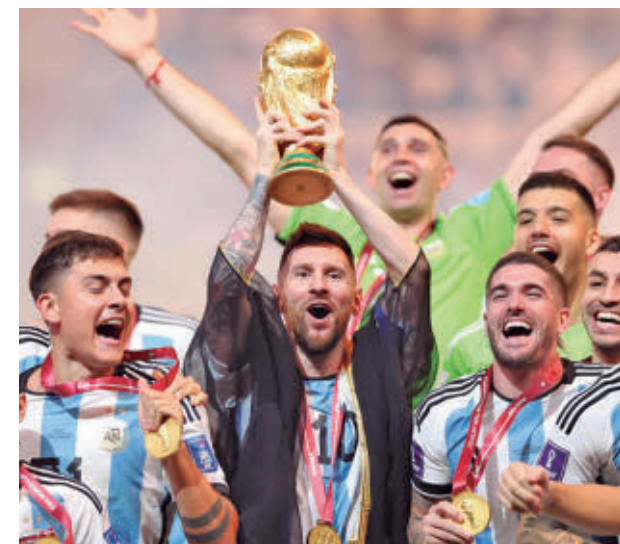
Messi hizo historia en Catar 2022

Brasil, encuadrada en el grupo C junto a Marruecos, Haití y Escocia, lo fía todo a la experiencia de Ancelotti y los destellos de jugadores como Vinicius, Raphinha o Neymar. Otra selección a seguir es Inglaterra, aunque por el momento es más noticia por las ausencias en la lista que por sus prestaciones.