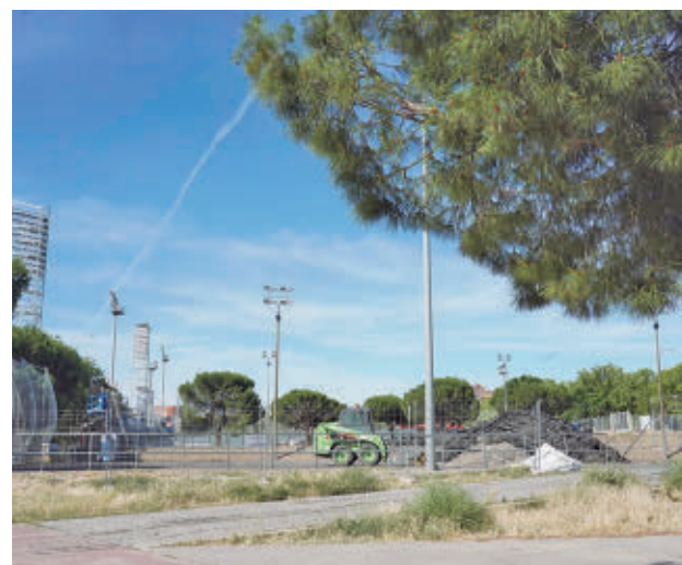
Maquinaria trabajando en la renovación de los campos

GenteMadrid.es Consulte la actualidad regional y local en nuestra página web