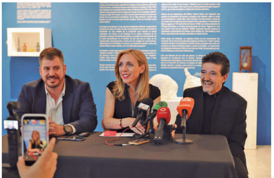
Rueda de prensa para dar a conocer la adjudicación de los edificios a Wonderland AYO DE ALCORCÓN