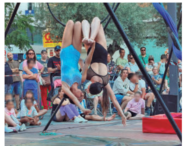
AYTO DE ALCORCÓN

Los alumnos y alumnas de El Circódromo trasladaron su trabajo a las calles de Alcorcón con una muestra abierta al público en la que exhibieron las habilidades y conocimientos adquiridos a lo largo del curso. La iniciativa permitió acercar el circo a la ciudadanía.