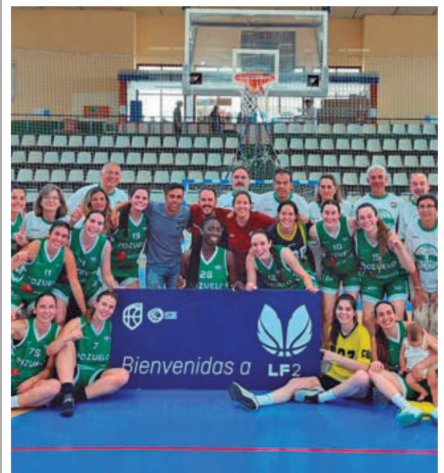
Plantilla del CB Pozuelo