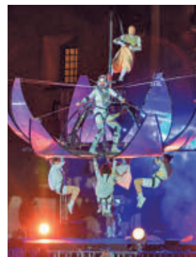
Clásicos en Alcalá

» Campo de Fútbol La Vía. Sábado 13, desde las 18 horas. 9,99 euros