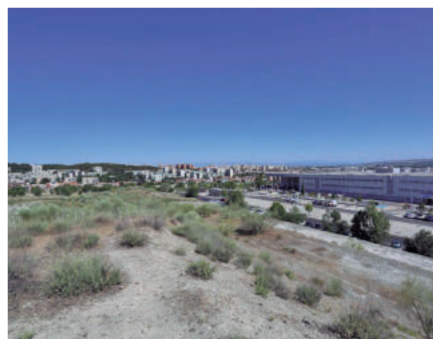
Zona en la que se actuará

"Sin duda alguna, esta nueva etapa que se abre es una ga-