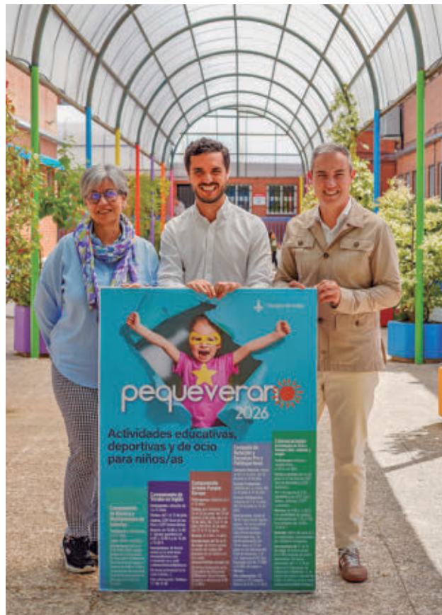
Presentación del programa municipal

Otra de las propuestas incluidas en Pequeverano es el Campamento Parque Europa 2026, destinado a menores de entre 4 y 13 años. Los par-