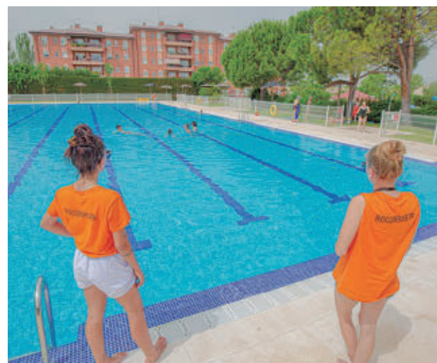
Una de las piscinas municipales de Rivas

GenteMadrid.es Consulte la actualidad regional y local en nuestra página web