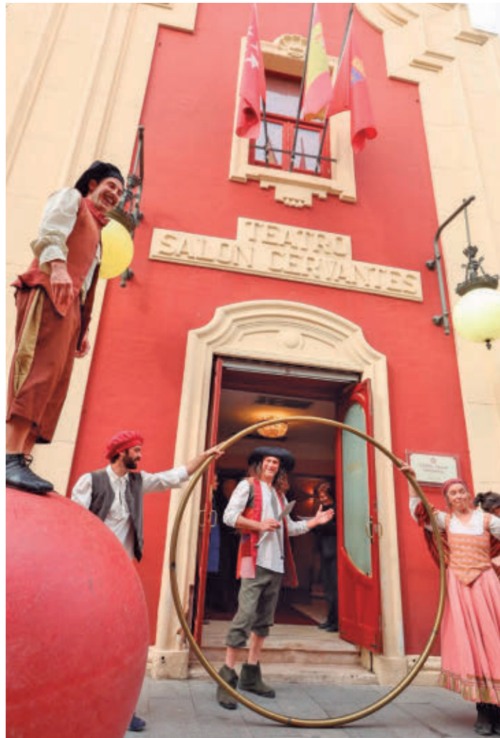
Presentación del festival