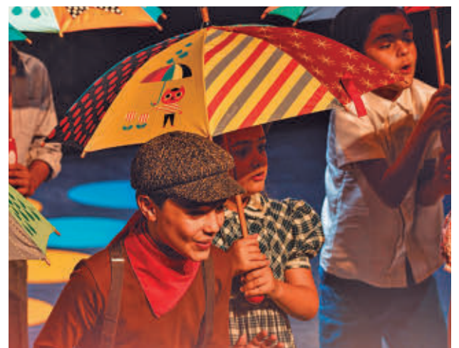
Esta zarzuela cuenta con más de un siglo de vida

Esa clarividencia también está presente a la hora de hablar de los desafíos que plantea en la creación literaria la Inteligencia Artificial: "La ventaja es que los escritores humanos somos de carne y hueso, sentimos dolor y alegría. Sin embargo, no tengo miedo a la IA, entre otras cosas porque el miedo no nos lleva a ningún sitio". La oscuridad es uno de los temas presentes en sus novelas, un asunto que conecta con la realidad mundial vigente: "Cuando viví en EEUU me di cuenta de que todas las malas ideas que tienen vinieron de Europa".