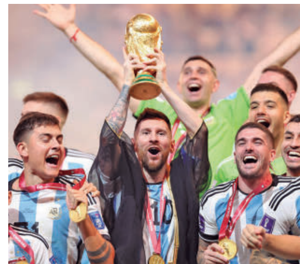
Messi hizo historia en Catar 2022

Competitividad: De la mano de Bielsa Uruguay trata de recuperar el nivel que le llevó a semifinales en 2010. A pesar de su mal final de curso, Valverde es su referente.