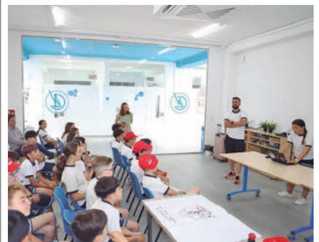
Alumnos del centro Los Naranjos AYUNTAMIENTO DE FUENLABRADA

El programa municipal de ocio inclusivo 'Salta conmigo' celebra este año su 30 aniversario con un incremento de más del 14% en el número de plazas, hasta alcanzar las 224. La iniciativa, impulsada por el Ayuntamiento de Fuenlabrada, cuenta con un presupuesto de 223.000 euros y está dirigida a personas de entre 14 y 55 años con discapacidad intelectual. La programación se diseña a partir de las propuestas de los propios participantes e incluye talleres de cocina y manualidades, visitas a museos, teatros, conciertos, cafeterías, restaurantes, discotecas, cines y boleterías. Además, contempla actividades al aire libre, como encuentros en parques, jornadas en la piscina, participación en las fiestas de la ciudad, escapadas de fin de semana y viajes a la playa.