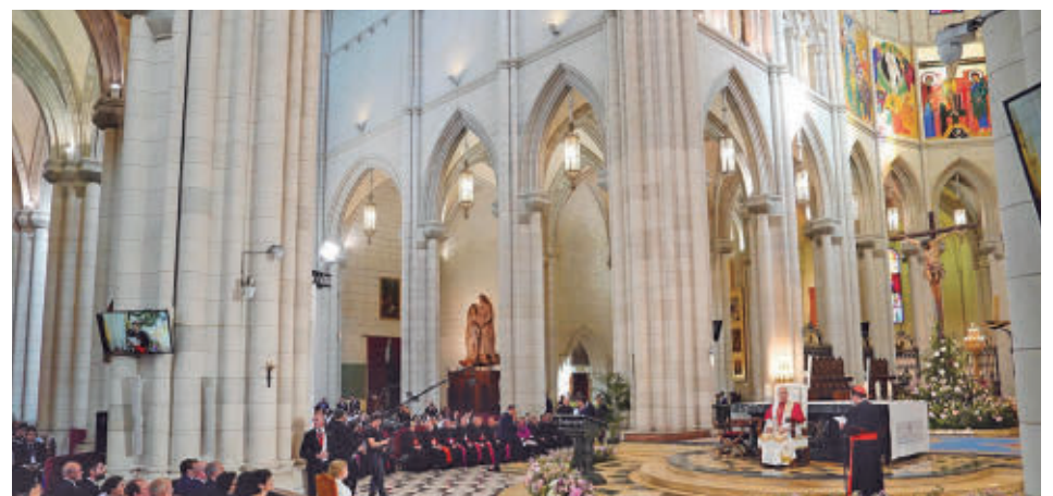
Acto en la catedral de la Almudena