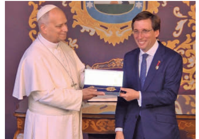
Entrega de la Llave de Oro de Madrid E.P.