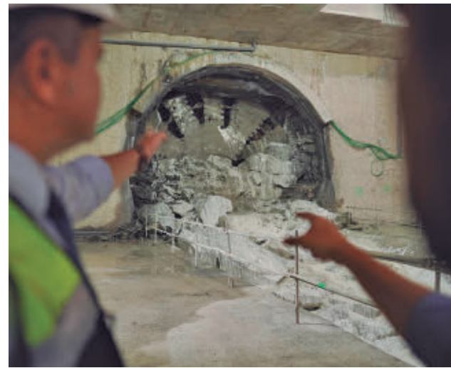
Momento en el que la tuneladora llega a Madrid Río