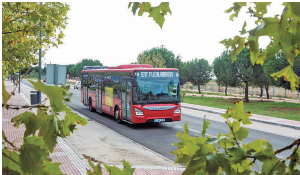
AYTO DE FUENLABRADA