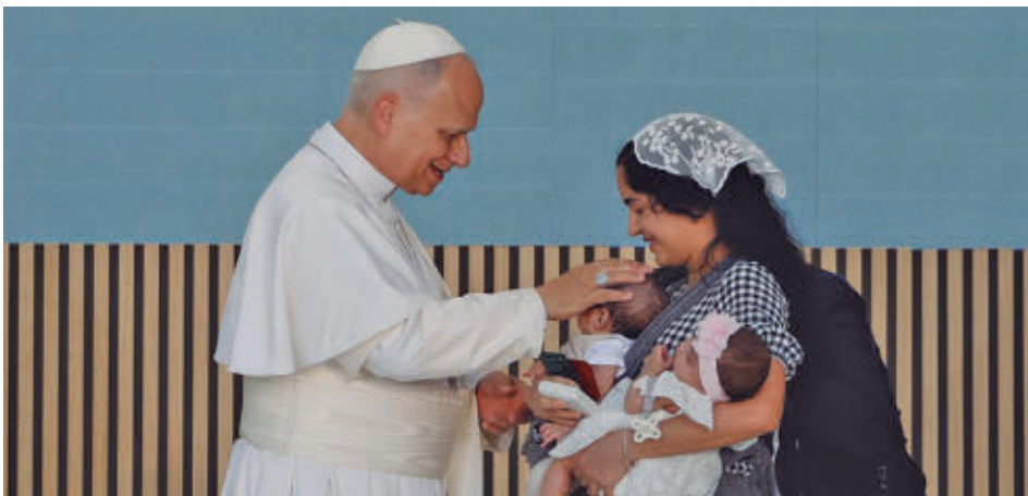
El Santo Padre acudió a un centro de personas sin hogar