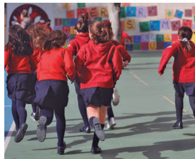
Los estudiantes ya tienen fecha de regreso E. P.

La infección más frecuente en España es la clamidia (41.918 casos), que ha experimentado un aumento de casi el 20% en los últimos años. Le siguen la infección gonocócica (37.257 casos) y la sífilis (11.930 casos).