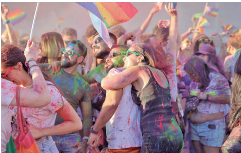
La marcha de los colores recorrerá el centro urbano AYUNTAMIENTO DE FUENLABRADA