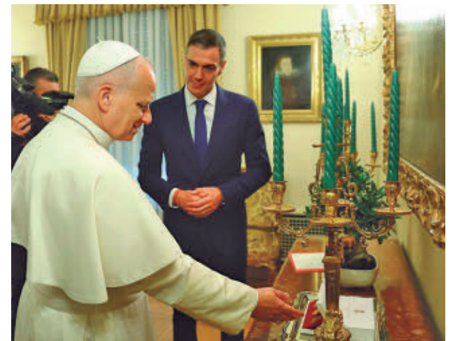
Reunión con Pedro Sánchez