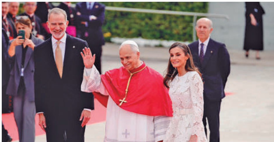
Recepción de Felipe VI y doña Letizia