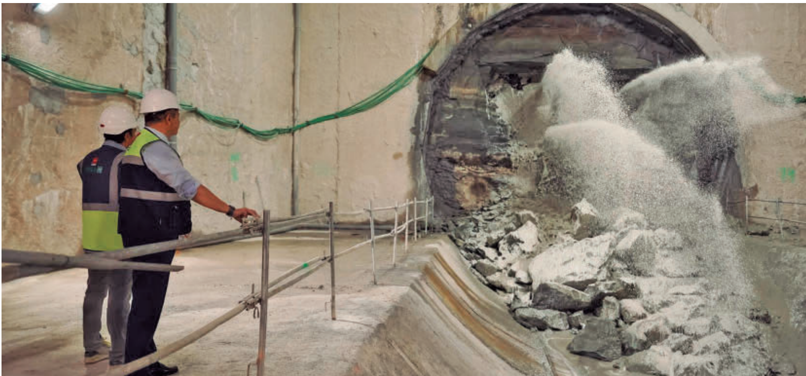
El consejero contempla el instante en el que 'Mayrit' llega a Madrid Río