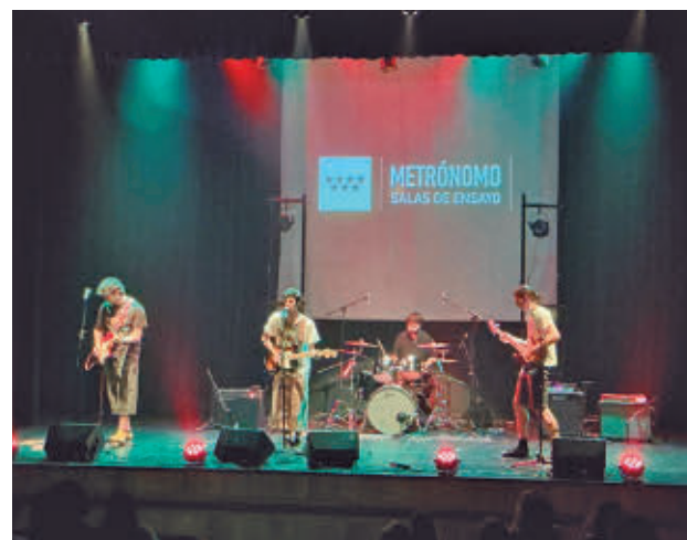
Músicos ensayando en Metrónomo

Las instalaciones, completamente insonorizadas, cuentan con el equipamiento necesario para que grupos y so-