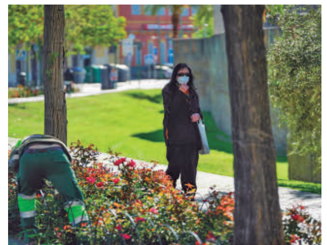
Las alergias se recrudecen con la contaminación E.P.

El estudio se ha hecho con los datos de las redes de calidad del aire y los servicios de alergología.