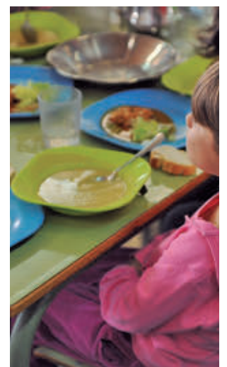
Una menor en el comedor