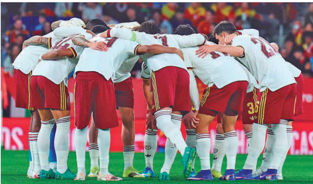
La selección, en un amistoso reciente durante el parón internacional de marzo