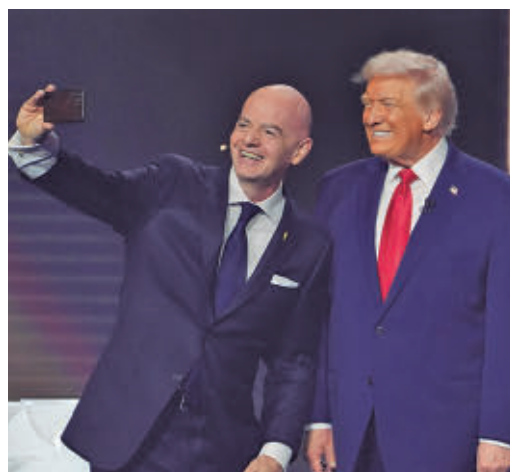
Infantino, junto a Donald Trump

EL PERIÓDICO GENTE NO SE RESPONSABILIZA NI SE IDENTIFICA CON LAS OPINIONES QUE SUS LECTORES Y COLABORADORES EXPONGAN EN SUS CARTAS Y ARTÍCULOS