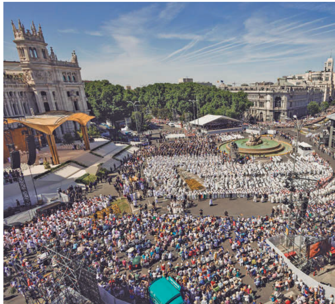
El acto más multitudinario fue en la plaza de Cibeles