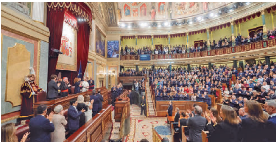
Un momento del discurso en el Congreso de los Diputados E. P.