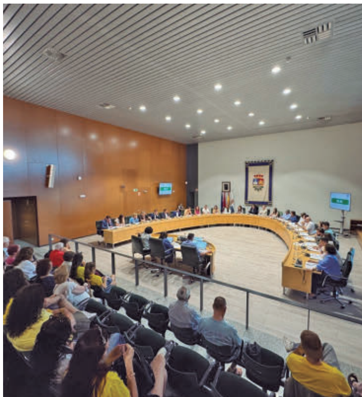
Un momento del Pleno AYTO DE FUENLABRADA

mientras que el PP optó por la abstención. Entre las medidas previstas figura la elaboración de un estudio de movilidad que analice la implantación de fórmulas de tráfico restringido para evitar que numerosos conductores utilicen las calles interiores como alternativa cuando se producen retenciones en la M-506. El acuerdo también contempla la puesta en marcha de actuaciones destinadas a mejorar el transporte público que presta la Empresa Municipal y trasladar al Consorcio Regional de Transportes nuevas demandas vecinales relacionadas con las