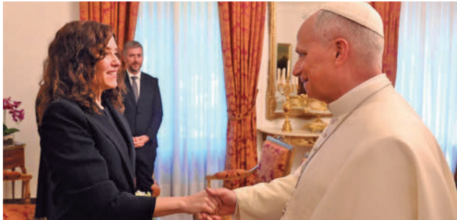
Isabel Díaz Ayuso mantuvo un encuentro privado