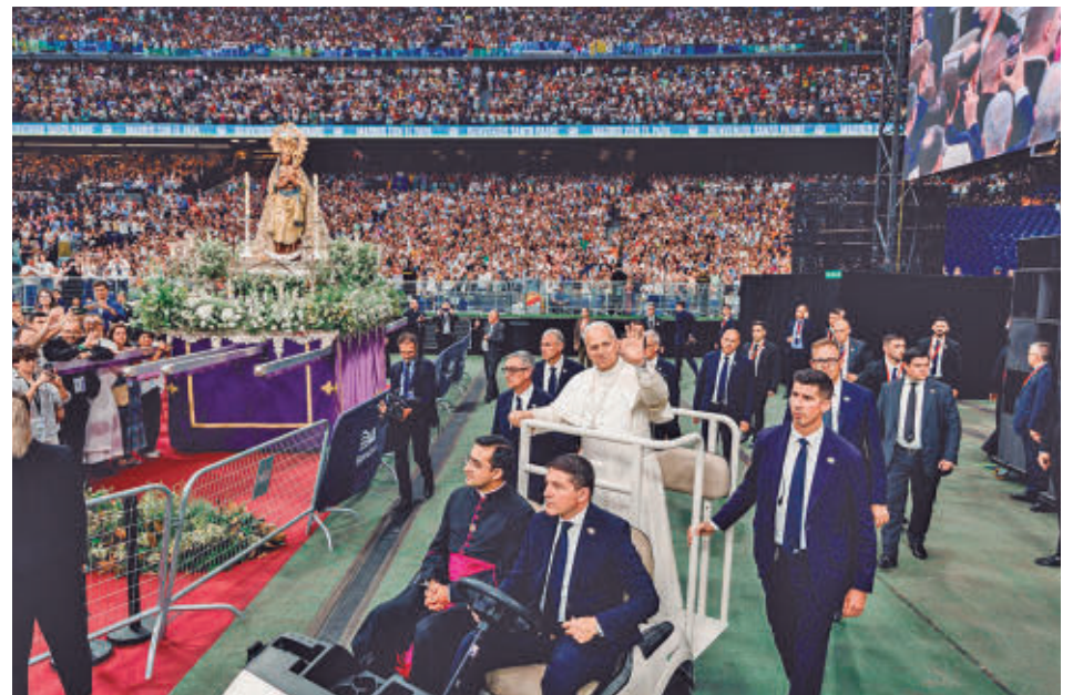
León XIV llegando al estadio Bernabéu E. P.

León XIV tuvo tiempo de reunirse con los reyes, con el presidente del Gobierno, con la presidenta de la Comunidad y con el alcalde de la capital. También acudió a lugares tan dispares como la catedral de la Almudena o al Movistar Arena, donde dejó imágenes para el recuerdo.