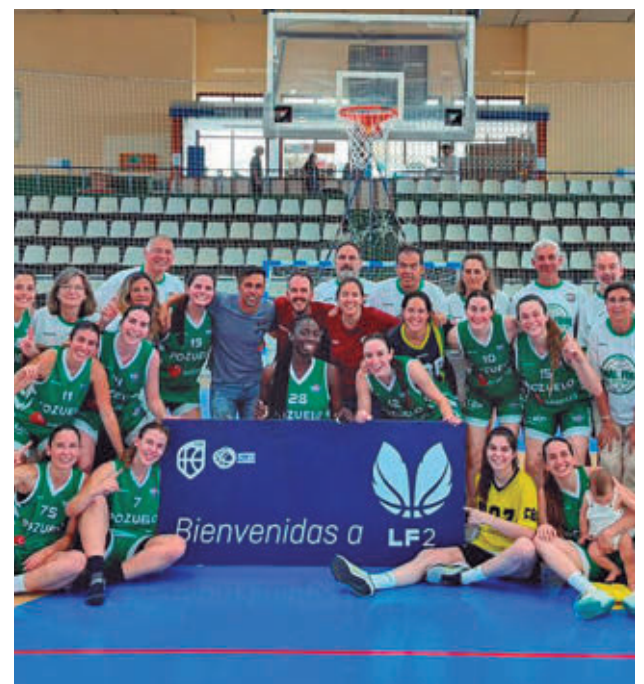
Plantilla del CB Pozuelo