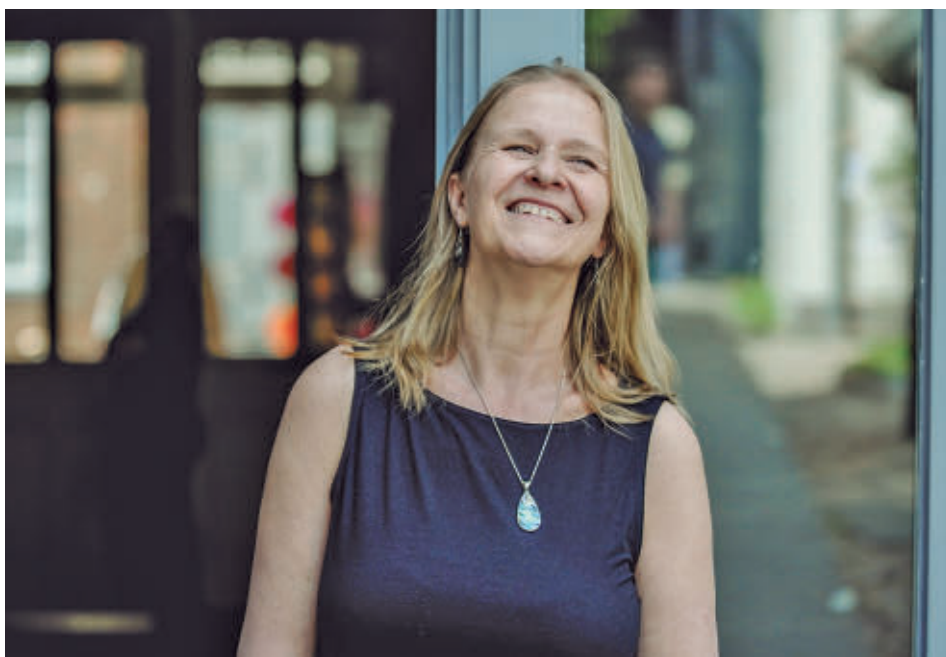
La autora visitó Madrid para estar presente en la Feria del Libro EDICIONES SIRUELA

» Auditorio del Parque París. Sábado 13, 21:30 horas. Acceso gratuito