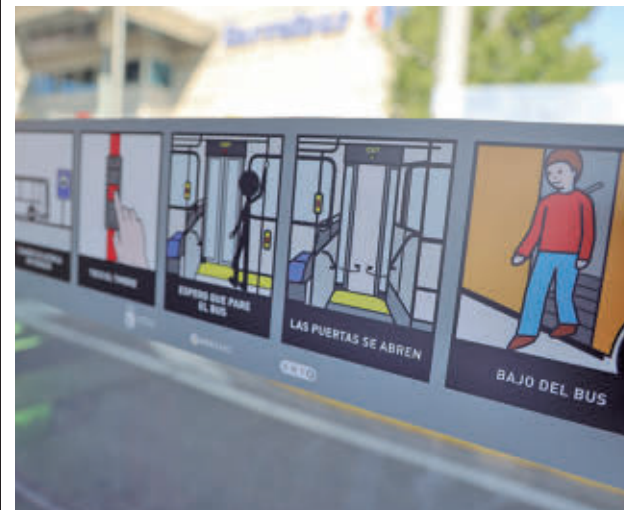
Los pictogramas llegan al transporte urbano