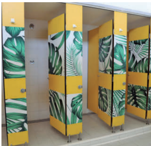
Se han renovado los vestuarios AYUNTAMIENTO DE GETAFE

Las altas temperaturas se pueden combatir ya en las instalaciones municipales al aire libre. La Campaña de Verano de Baños 2026 se desarrolla hasta el 30 de agosto en las