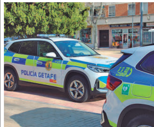
Imagen de archivo de un coche de Policía Local AYTO DE GETAFE

GenteMadrid.es Consulte la actualidad regional y local en nuestra página web