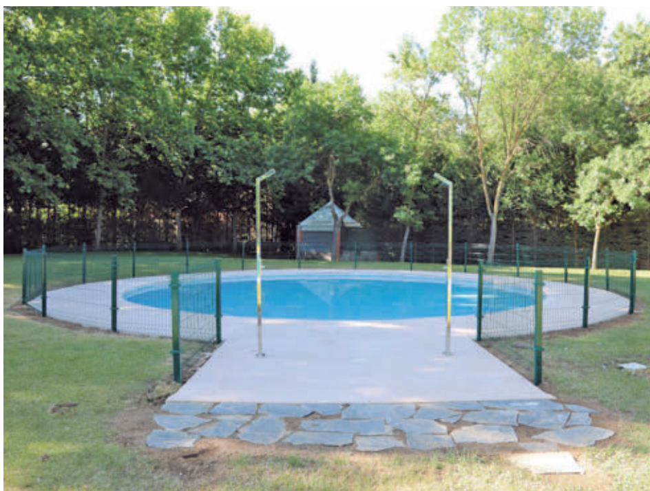
Nueva imagen de la piscina infantil AYUNTAMIENTO DE GETAFE