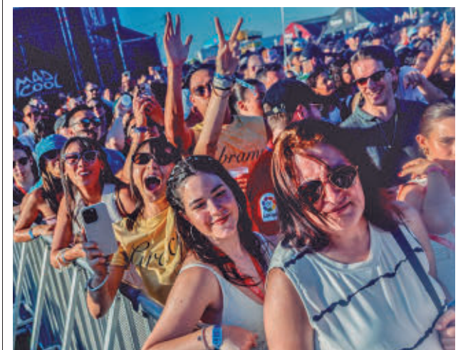
Ambiente previo en el recinto Iberdrola Music

Durante la huida, el sospechoso embistió varios vehículos policiales tanto en la A-42 como en distintas calles del sur de Madrid. El operativo conjunto permitió interceptar finalmente el coche y también arrestar a sus tres ocupantes.