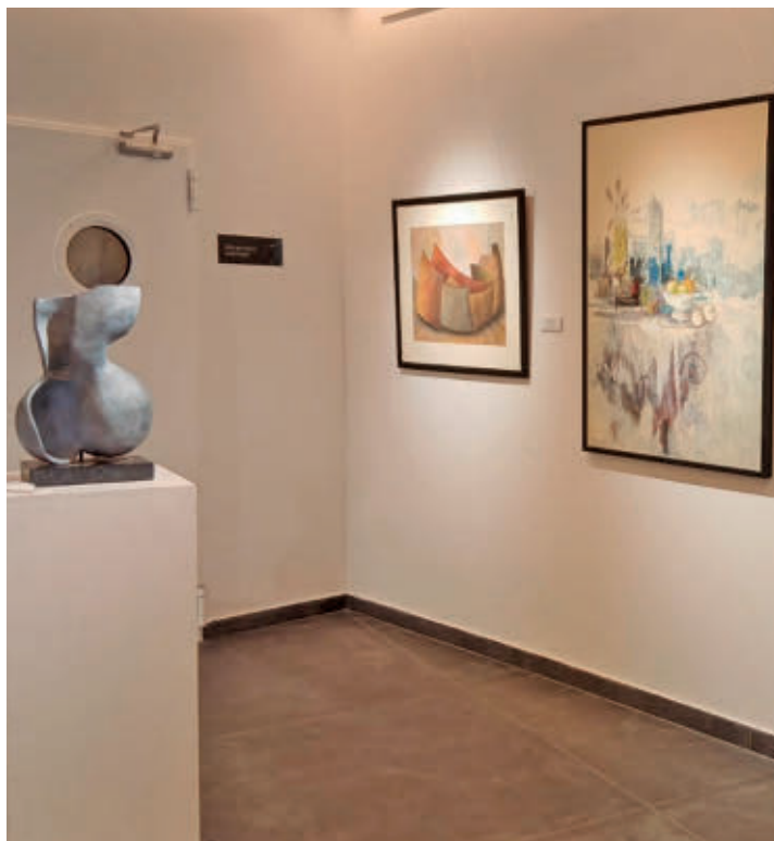
La exposición 'Abriendo puertas', primera actividad del centro

La muestra, que permanecerá abierta hasta el próximo 31 de julio, ofrece además la oportunidad de descubrir por primera vez este edificio concebido como un espacio cultural polivalente. Las visitas podrán realizarse de lunes a viernes entre las 10 y las 14 horas y de 17 a 21 horas; los sábados, de 11 a 14 y de 17 a 20 horas; y los domingos, de 11 a 14 horas. El nuevo teatro se