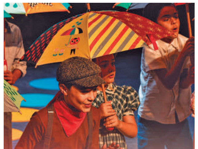
Esta zarzuela cuenta con más de un siglo de vida

Esa clarividencia también está presente a la hora de hablar de los desafíos que plantea en la creación literaria la Inteligencia Artificial: "La ventaja es que los escritores humanos somos de carne y hueso, sentimos dolor y alegría. Sin embargo, no tengo miedo a la IA, entre otras cosas porque el miedo no nos lleva a ningún sitio". La oscuridad es uno de los temas presentes en sus novelas, un asunto que conecta con la realidad mundial vigente: "Cuando viví en EEUU me di cuenta de que todas las malas ideas que tienen vinieron de Europa".