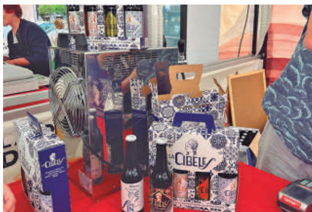
Puesto de cervezas artesanas

rio, para que no sea un hecho puntual, sino parte de una estrategia de ciudad para apoyar a los productores y dinamizar los espacios públicos”, añadió el edil.