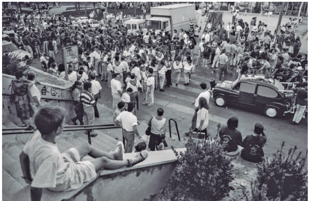
Una imagen histórica de Leganés

La investigación también documenta la desaparición de numerosos espacios vinculados al ocio y la identidad