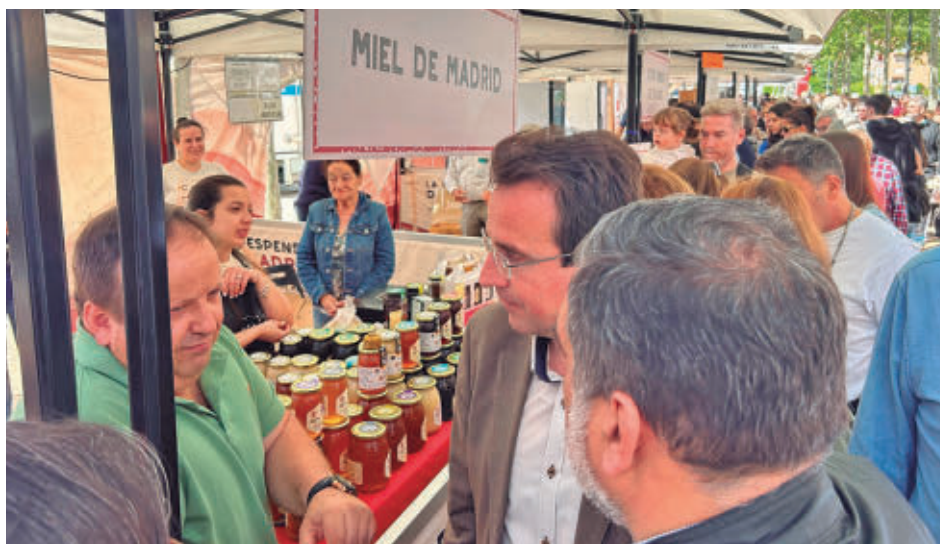
El alcalde visitó la Despensa de Madrid en mayo

El evento se celebrará este sábado 13 de junio entre las 10 y las 15 horas en la Plaza de la Policía Nacional tras el éxito de la Despensa de Madrid en mayo