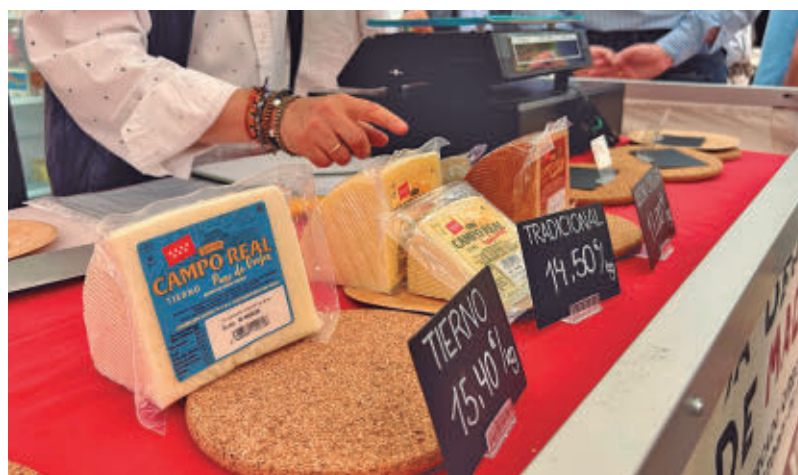
Los quesos de la región tendrán su espacio