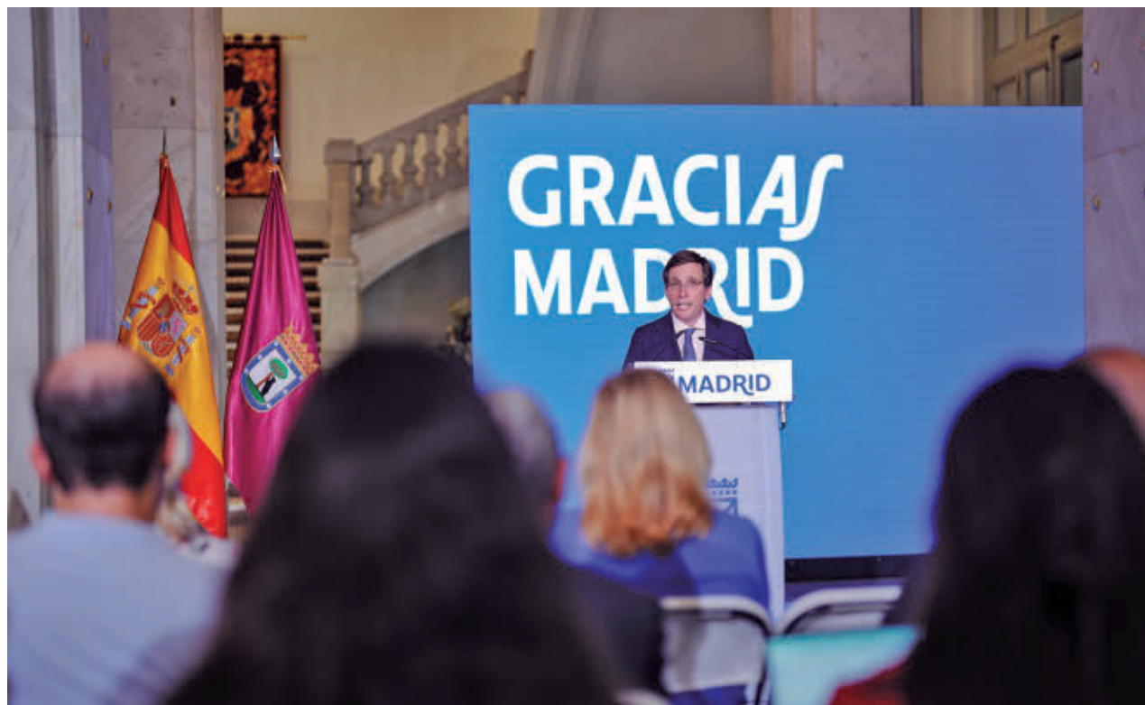
Un momento de la comparencia del alcalde en Cibeles

Almeida precisó que la bicicleta fue la gran protagonista de la movilidad, del 3 al 9 de junio, durante el periodo de gratuidad de la EMT y de bicimad. Los autobuses urbanos transportaron de forma gratuita, en solo siete días, a 10,4 millones de usuarios, mientras que el servicio de alquiler de bicis alcanzó los 525.000 viajes, marcando un récord histórico.