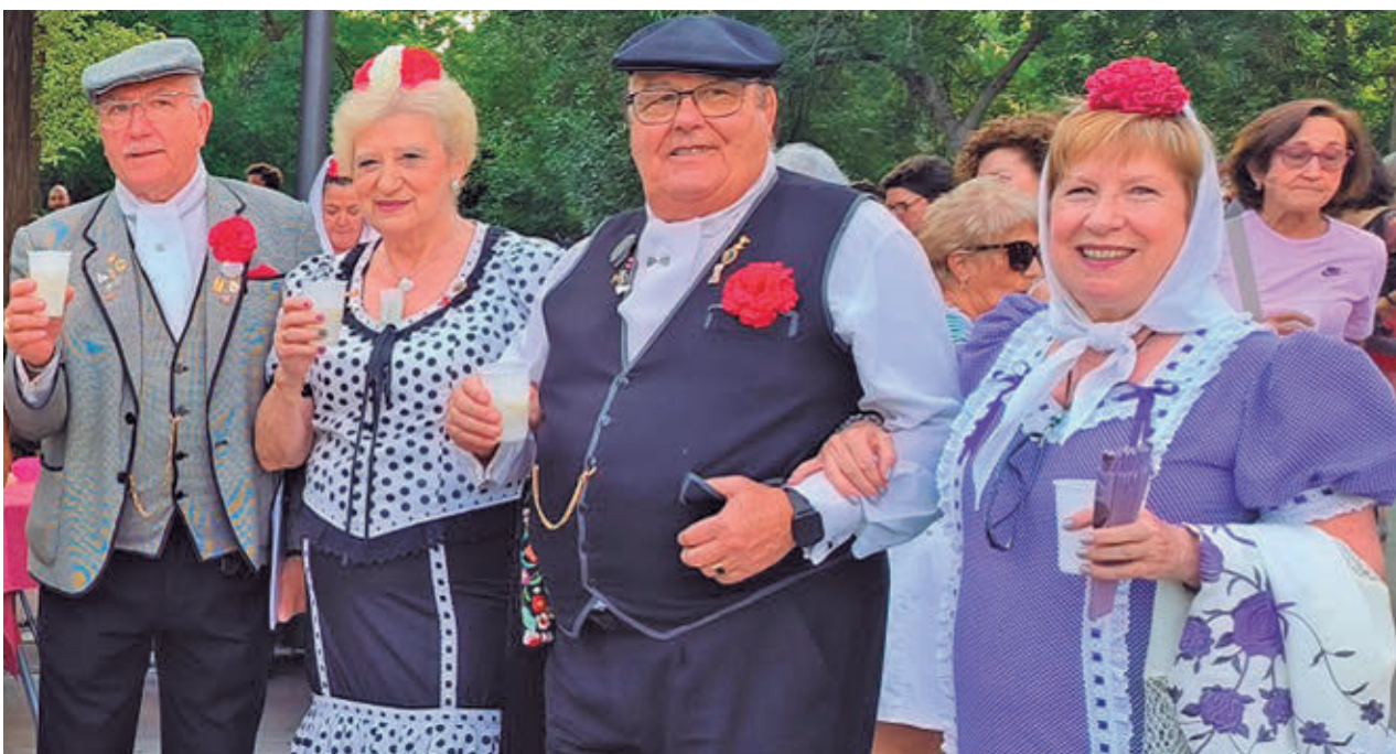
Chulapos y chulapas volverán a exhibir sus mejores galas en la primera verbena del verano en la capital