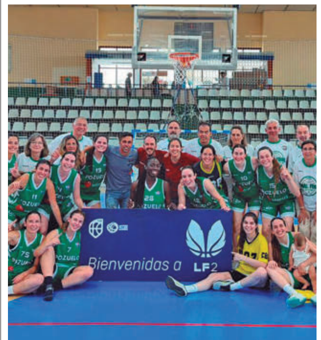
Plantilla del CB Pozuelo