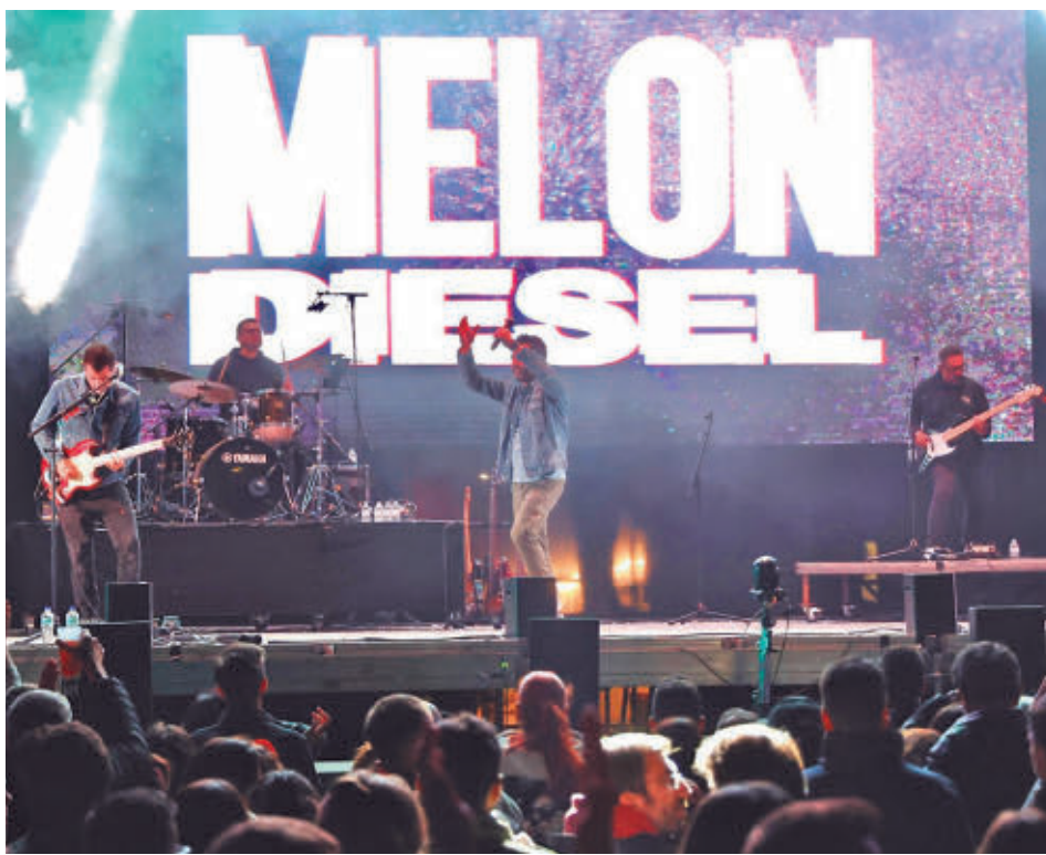
El grupo gibraltareño Melon Diesel, en concierto