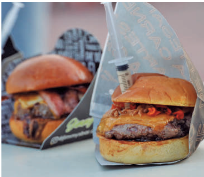
Un evento gastronómico especializado en hamburguesas gourmet

Evento familiar y gastronómico tendrá lugar hasta el domingo en la zona de fuentes del Parque Finca Liana • 11 food trucks, comida callejera, animación musical, zona infantil y sorteos