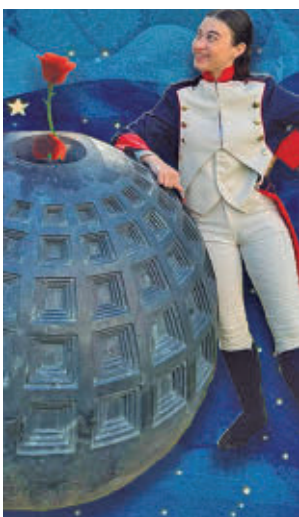
En el Jardín de los Planetas