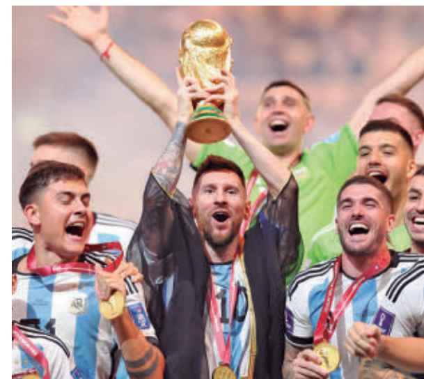
Messi hizo historia en Catar 2022

Brasil, encuadrada en el grupo C junto a Marruecos, Haití y Escocia, lo fía todo a la experiencia de Ancelotti y los destellos de jugadores como Vinicius, Raphinha o Neymar. Otra selección a seguir es Inglaterra, aunque por el momento es más noticia por las ausencias en la lista que por sus prestaciones.