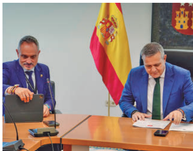
Ayuntamiento y Comunidad de Madrid avanzan en proyectos

La cibercriminalidad descendió un 0,9%, con una reducción de las estafas informáticas.