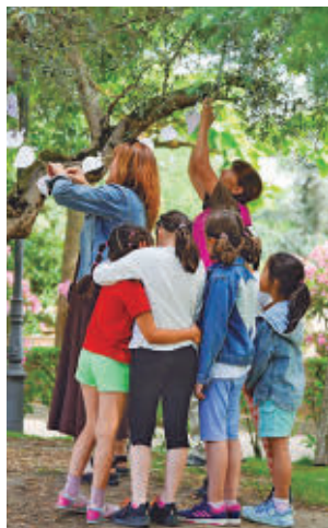
Ubicado en Finca Liana

El 'Árbol de los Deseos' se inspira en un cuento homónimo elaborado a partir de las inquietudes y aspiraciones