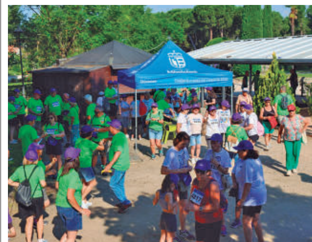
Actividades gratuitas para disfrutar en familia

El sorteo de plazas tendrá lugar el lunes 22 de junio, a las 12 horas, en el CMM La Princesa. La lista de admitidos se publicará del 14 al 18 de septiembre en los centros de mayores.