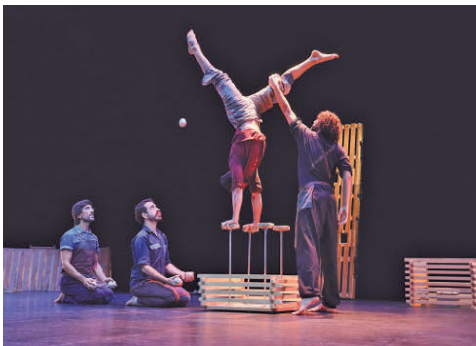
La programación estará compuesta por tres espectáculos gratuitos y para todos los públicos

La siguiente cita tendrá lugar el sábado 20 con 'Nüshu', de la compañía Capicúa. Ambientada en una antigua fábrica de tejanos, la representación está protagonizada por cinco mujeres acróbatas que convier-