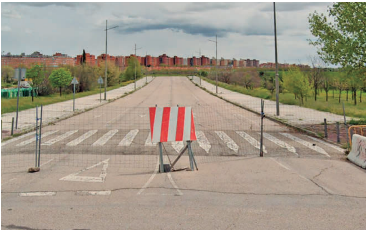
El proyecto da respuesta a una demanda histórica de los vecinos del PAU-4