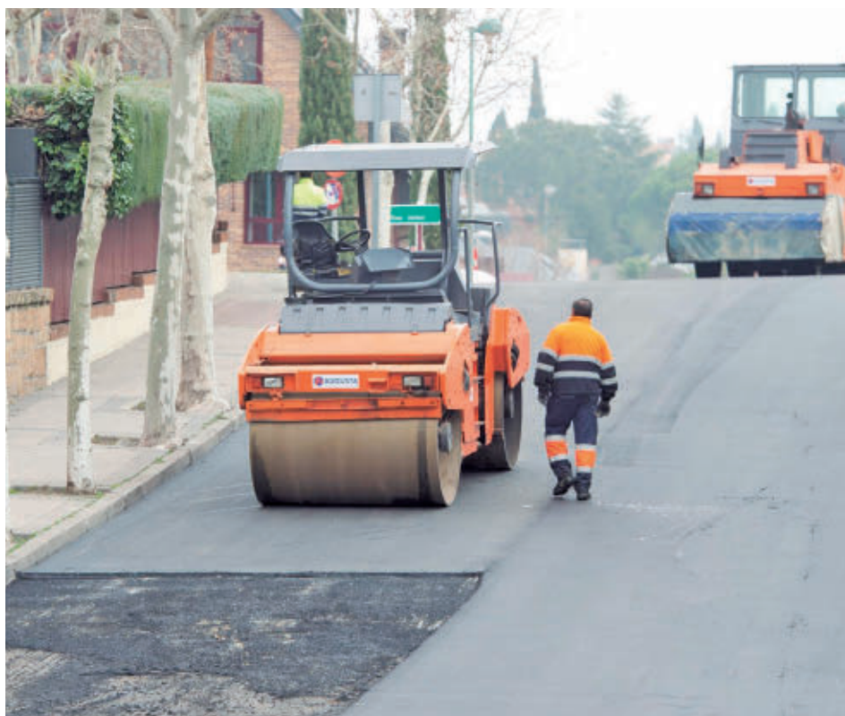
Labores de asfaltado de una de las calles de Pozuelo de Alarcón

Los interesados deberán presentar online la solicitud a través del Portal del Candidato para nuevo ingreso o en el Portal Universitario para renovación de la beca, del 15 al 30 de junio, para nuevos alumnos, y hasta el 30 de junio o del 10 al 25 de julio para alumnado de renovación.