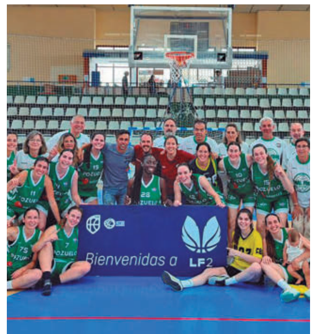
Plantilla del CB Pozuelo