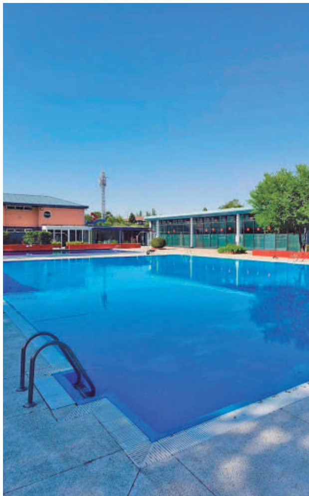
Piscina municipal de Pinto

La piscina municipal cuenta con varios vasos, entre ellos una piscina olímpica de 50 por 25 metros, una piscina polivalente y otra de re-