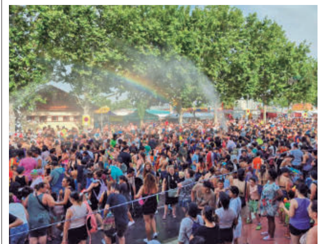
Gran Fiesta del Agua y la Espuma

Se trata de una cita especial en la que los participantes de todos los talleres de la asociación mostrarán sobre el escenario el trabajo realizado durante el curso a través de actuaciones de teatro, doblaje, canciones en lengua de signos española, baile y numerosas sorpresas. Las entradas tienen un precio simbólico de 3 euros y pueden adquirirse de forma anticipada en la sede de la asociación, (C/ Hierro, 6) este viernes de 17 a 21 horas o el mismo sábado 14 desde una hora antes del inicio del espectáculo en la taquilla de Restón Cinema.