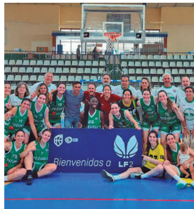
Plantilla del CB Pozuelo