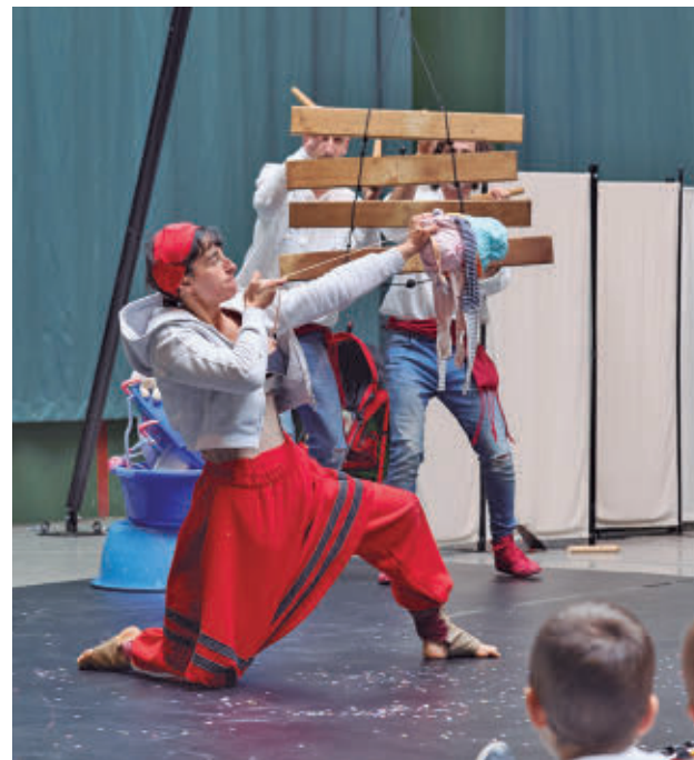
La pieza también llegará a Huesca en septiembre

EXPRESIVIDAD: ‘La caricia de la diferencia’ examina el peso físico y emocional de cuidar con una mirada que no renuncia al humor y la ternura