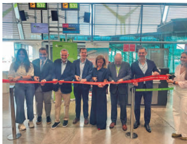
Inauguración de la nueva ruta aérea IBERIA

que el proyecto de Mading “simboliza la enorme fortaleza” que vive el automovilismo español. “España ocupa una posición de enorme importancia, con pruebas internacionales en todas las especialidades, una amplia red de circuitos, organizadores experimentados y una afición que es patrimonio del automovilismo español”, indicó.