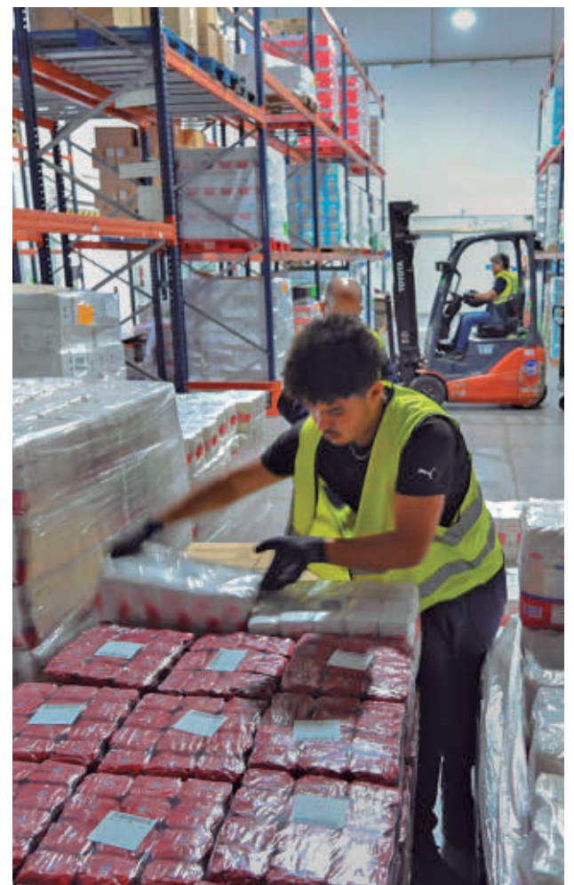
Uno de los operarios de la campaña FUNDACIÓN LA CAIXA

transformación, pero es imprescindible complementar este acompañamiento con la cobertura de recursos básicos como la alimentación", señaló por su parte el subdirector general de la Fundación La Caixa, Marc Simón.