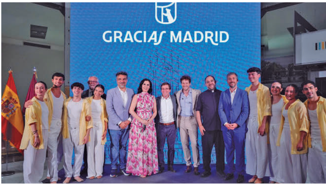
Foto de familia de las autoridades con los representantes de los organizadores de la visita de León XIV