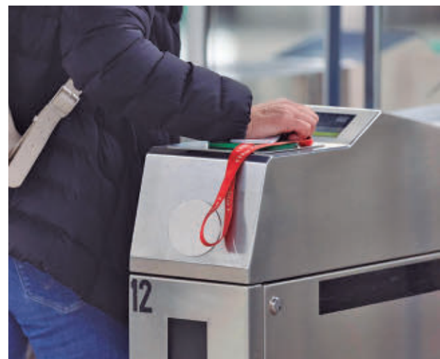
Un viajero usa la Tarjeta de Transportes E.P.