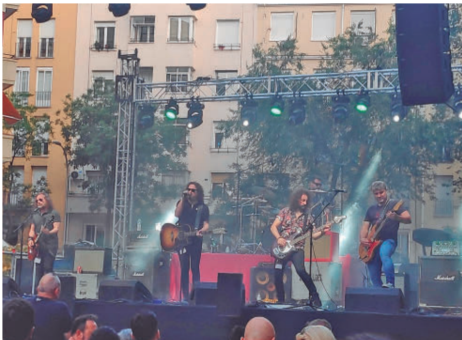
El escenario situado en la calle de Narváez