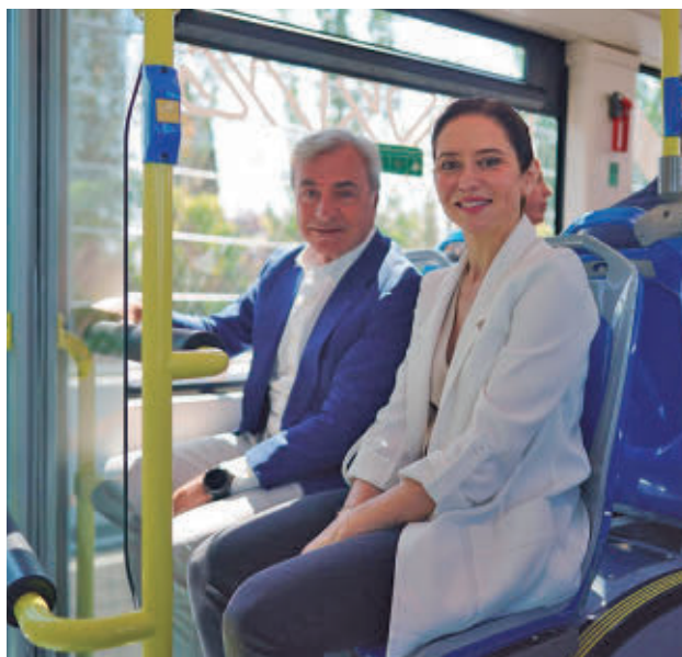
En autobús junto a un campeón: La presidenta de la Comunidad de Madrid, Isabel Díaz Ayuso, recorrió el trazado en autobús acompañada por Carlos Sainz Sr. y se mostró convencida de que se va a convertir en el “mejor circuito del mundo”.

“Madrid no se parece a ningún circuito, tiene carácter propio, muy reconocible, un circuito a la madrileña, que se está dotando para conducirnos a la celebración de un