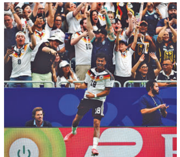
Alemania no tuvo piedad de Curaçao FIFA

Ante un rival que se base en el planteamiento defensivo, De la Fuente podría buscar alternativas en los extremos, donde España echó de menos a Lamine Yamal y Nico Williams, dos futbolistas clave en la última Eurocopa y que han llegado al Mundial tocados. “El objetivo es ir dándoles minutos, que adquieran confianza y ritmo para que en próximos compromisos estén mejor”, apuntó De la Fuente.