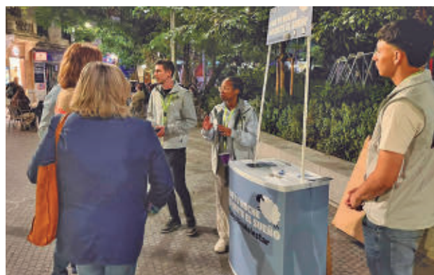
Uno de los puntos de información de la campaña

La iniciativa, dirigida a los locales y sus usuarios, contempla la instalación de puntos de información en la vía pública, el trabajo de media-