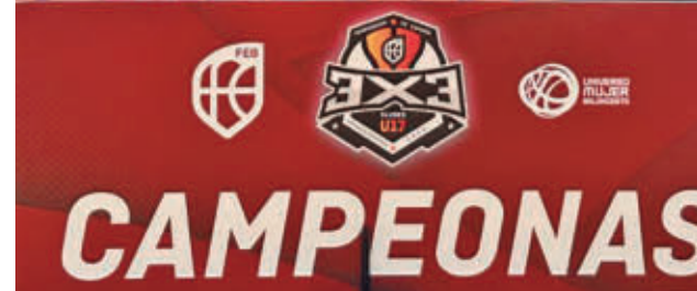
Las campeonas posan con el trofeo FBM