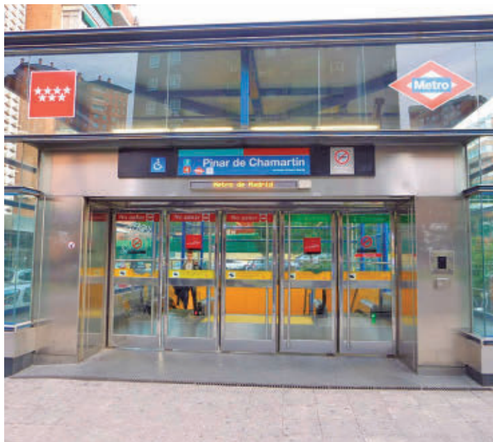
Uno de los accesos a la estación de Pinar de Chamartín

Pinar de Chamartín seguirá formando parte en un futuro de la Línea 1 de Metro. El consejero de Transportes, Jorge Rodrigo, confirmó este lunes 15 de junio que no habrá “ningún tipo de diferencia” en la prestación del servicio en el marco de los planes de la compañía para llevar el suburbano al nuevo desarrollo de Madrid Nuevo Norte, desechando así la opción que