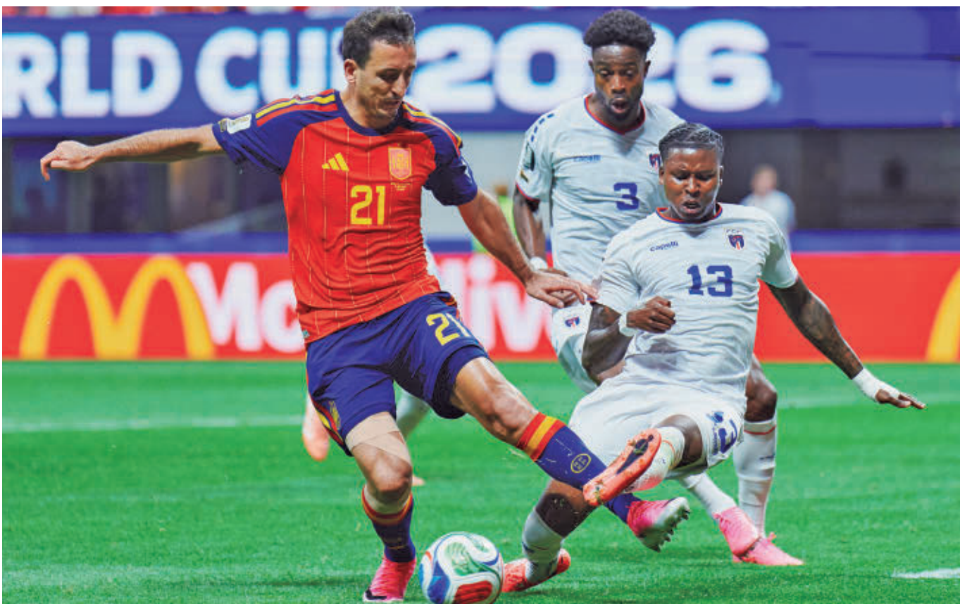
Mikel Oyarzabal no cuajó una buena actuación ante Cabo Verde