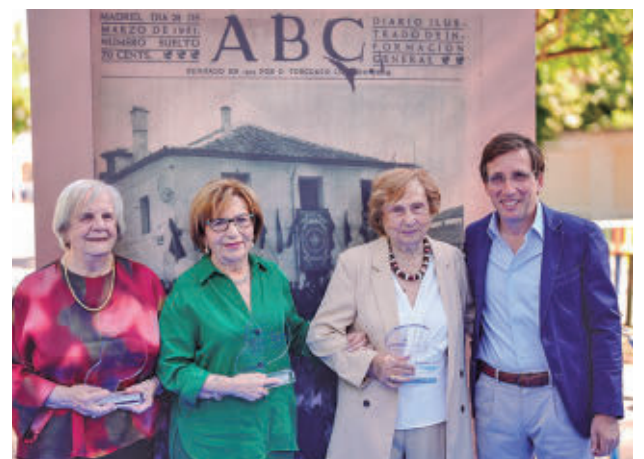
El acto de conmemoración fue presidido por el alcalde

GenteMadrid.es Consulte la actualidad regional y local en nuestra página web