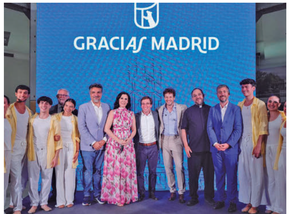
Foto de las autoridades con los representantes de los organizadores de la visita de León XIV

sido “uno de los elementos más emblemáticos” que hubo durante la visita de León XIV y su permanencia es además “una reivindicación de los madrileños”. “Estamos estudiando las características técnicas del terreno. Un análisis preliminar nos dice que