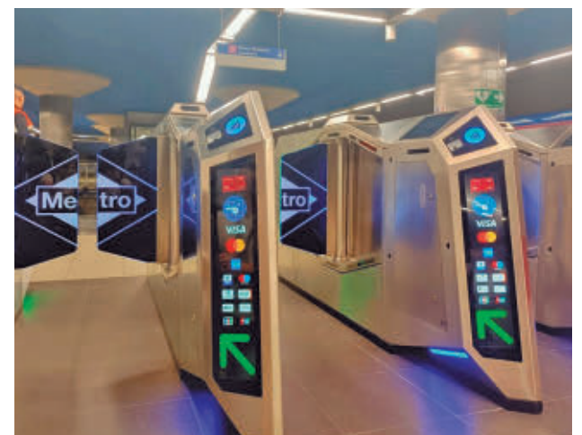
Tornos que permiten el pago con tarjeta bancaria

Por estaciones, Sol encabeza la lista con más de 10.000 registros, seguida por Estadio Metropolitano y estaciones muy influenciadas por la visita del Papa como Nuevos Ministerios, Gran Vía o Atocha. En el 'top 20' también se cuela la estación del aeropuerto.