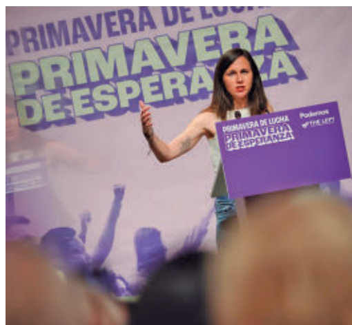
Ione Belarra, durante un acto

EL PERIÓDICO GENTE NO SE RESPONSABILIZA NI SE IDENTIFICA CON LAS OPINIONES QUE SUS LECTORES Y COLABORADORES EXPONGAN EN SUS CARTAS Y ARTÍCULOS