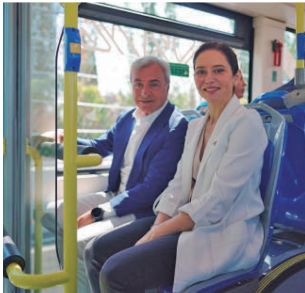
En autobús junto a un campeón: La presidenta de la Comunidad de Madrid, Isabel Díaz Ayuso, recorrió el trazado en autobús acompañada por Carlos Sainz Sr. y se mostró convencida de que se va a convertir en el “mejor circuito del mundo”.

“Madrid no se parece a ningún circuito, tiene carácter propio, muy reconocible, un circuito a la madrileña, que se está dotando para conducirnos a la celebración de un