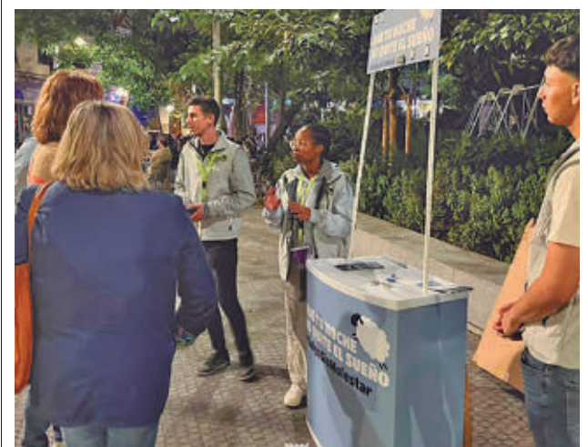
Uno de los puntos de información de la campaña