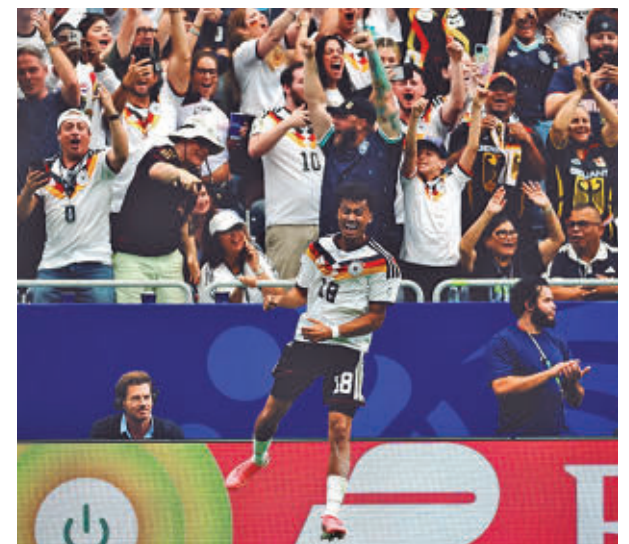
Alemania no tuvo piedad de Curaçao

Ante un rival que se base en el planteamiento defensivo, De la Fuente podría buscar alternativas en los extremos, donde España echó de menos a Lamine Yamal y Nico Williams, dos futbolistas clave en la última Eurocopa y que han llegado al Mundial tocados. “El objetivo es ir dándoles minutos, que adquieran confianza y ritmo para que en próximos compromisos estén mejor”, apuntó De la Fuente.