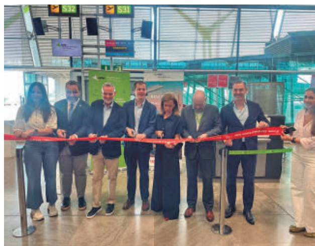
Inauguración de la nueva ruta aérea IBERIA

que el proyecto de Mading “simboliza la enorme fortaleza” que vive el automovilismo español. “España ocupa una posición de enorme importancia, con pruebas internacionales en todas las especialidades, una amplia red de circuitos, organizadores experimentados y una afición que es patrimonio del automovilismo español”, indicó.