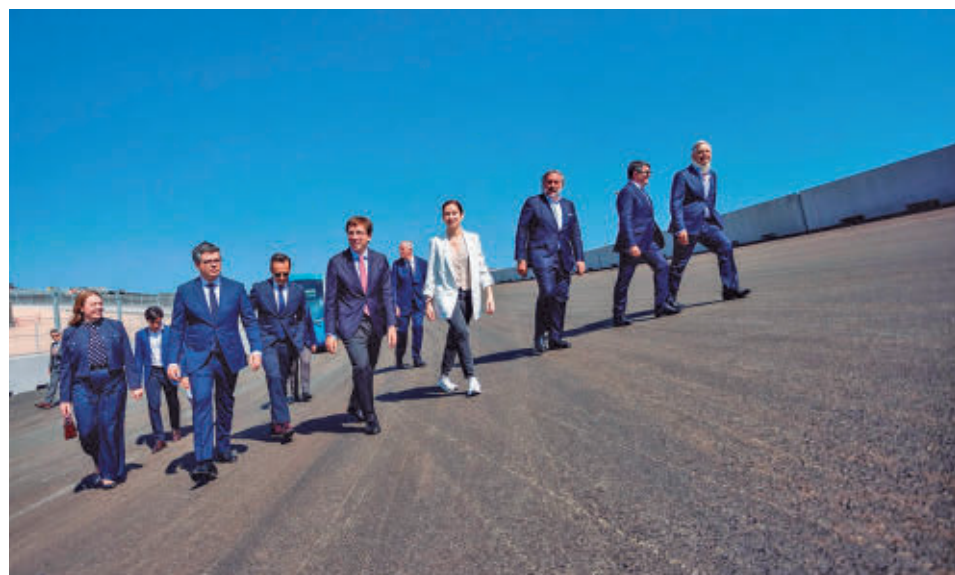
Las autoridades pudieron pasear por una parte del circuito

rar dudas y falta de confianza” sobre el proyecto, que “ha exigido lo mejor” de Ifema y sus trabajadores.