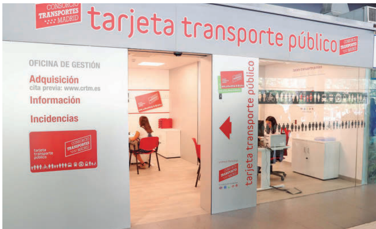
Una de las oficinas en las que se gestiona la Tarjeta de Transporte Público