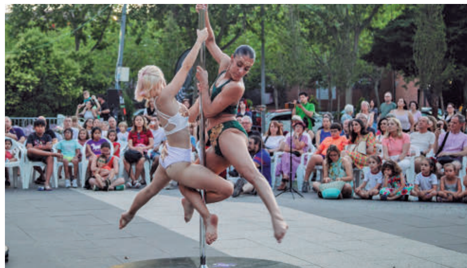
Estos espectáculos cuentan con público de todas las edades

La primera cita tendrá lugar este viernes 19 (20:30 horas, plaza de Antonio Gala) de la mano de 'Impakto', un espectáculo con el sello de la compañía Frutites Tropic-