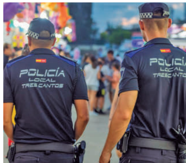
Efectivos de Policía Local AYUNTAMIENTO DE TRES CANTOS

Por otro lado, se han instalado salas adaptadas con cambiador y espacio de lactancia junto a la entrada principal del Recinto Ferial. Estarán operativas todos los días de 19:30 a 1 de la madrugada. Además, durante todas las fiestas habrá disponibles aseos atendidos por personal de limpieza, también junto a la entrada principal del Recinto Ferial y en la zona de las atracciones.