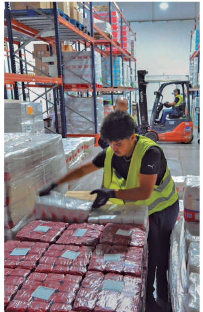
Uno de los operarios de la campaña FUNDACIÓN LA CAIXA