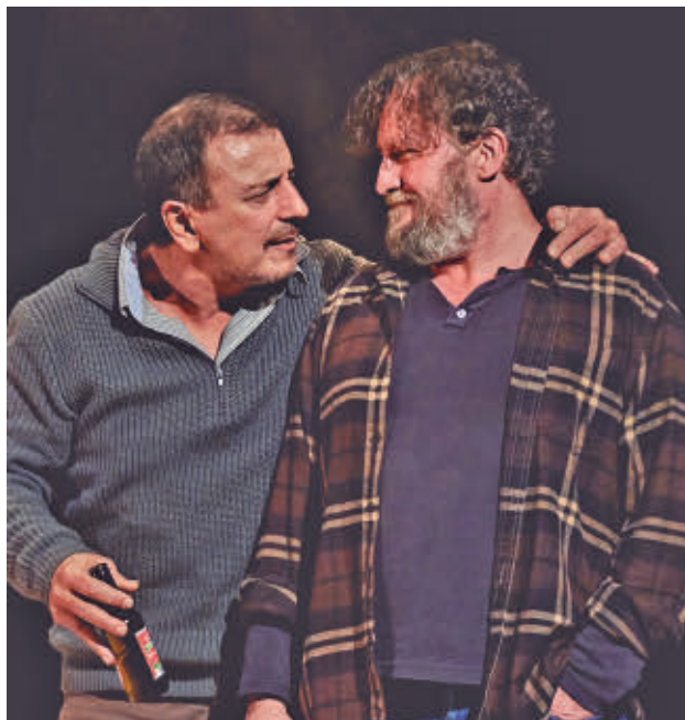
La obra se representa en la Sala Roja Concha Velasco

La propuesta trasladada al escenario una historia cen-