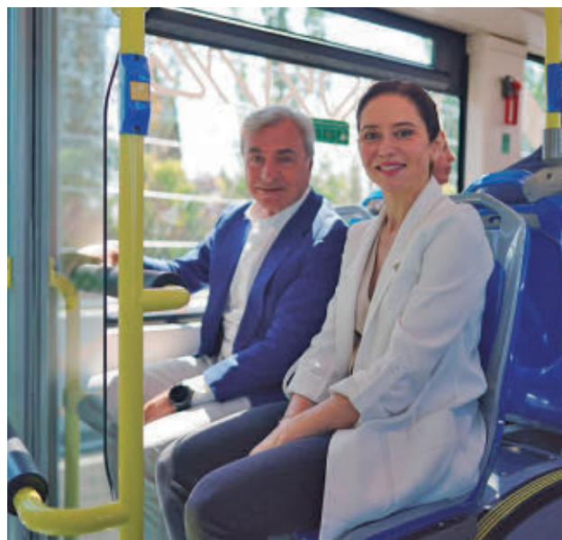
En autobús junto a un campeón: La presidenta de la Comunidad de Madrid, Isabel Díaz Ayuso, recorrió el trazado en autobús acompañada por Carlos Sainz Sr. y se mostró convencida de que se va a convertir en el “mejor circuito del mundo”.

“Madrid no se parece a ningún circuito, tiene carácter propio, muy reconocible, un circuito a la madrileña, que se está dotando para conducirnos a la celebración de un