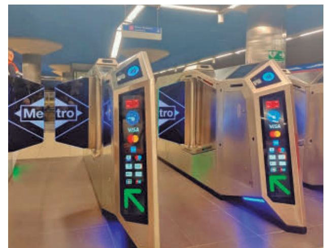
Tornos que permiten el pago con tarjeta bancaria E.P.

Por estaciones, Sol encabeza la lista con más de 10.000 registros, seguida por Estadio Metropolitano y estaciones muy influenciadas por la visita del Papa como Nuevos Ministerios, Gran Vía o Atocha. En el 'top 20' también se cuela la estación del aeropuerto.