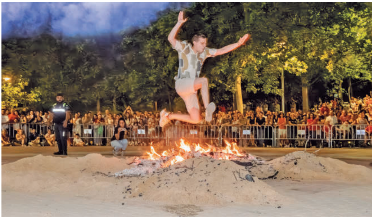
AYTO DE TRES CANTOS