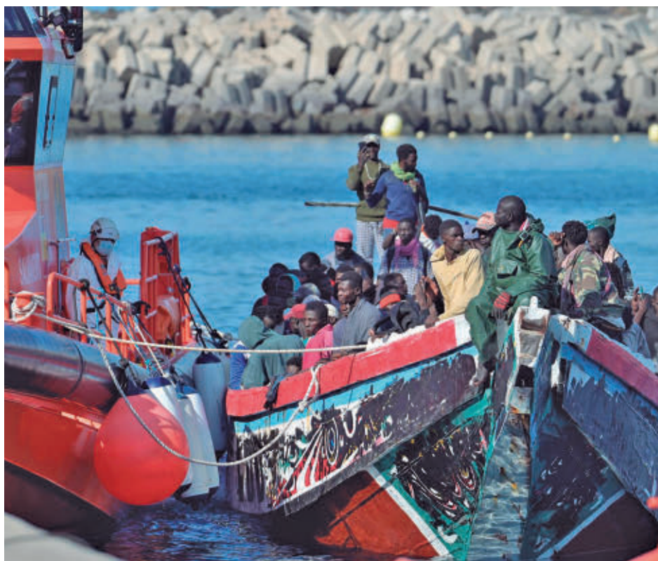
Un grupo de migrantes llegan a Canarias en una embarcación

El desacuerdo entre las dos administraciones en materia migratoria también alcanza al proceso de regularización del Gobierno central, que esta semana ha cerrado su plazo