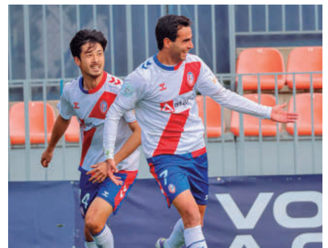
El Rayo logró el ascenso como campeón de grupo

La última jornada se jugará el 9 de mayo. Solo Getafe B y Alcalá serán locales.