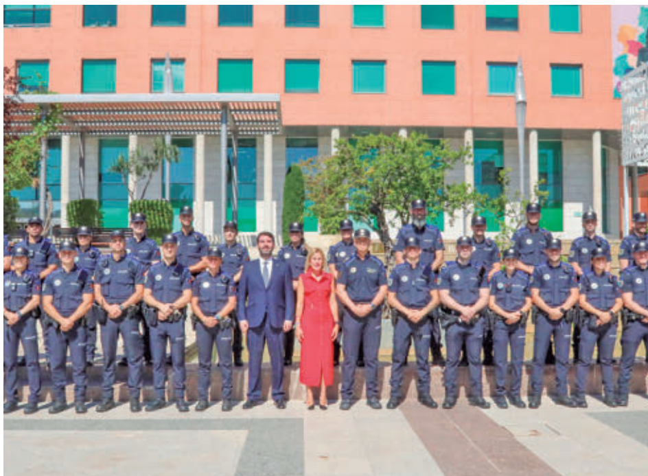
Foto de familia en la Plaza Mayor AYUNTAMIENTO DE ALCOBENDAS