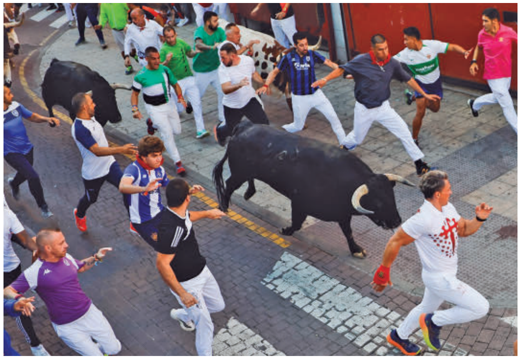
Es uno de los eventos más multitudinarios de las fiestas AYTO DE SAN SEBASTIÁN DE LOS REYES

La Castilleja y Núñez de Tariña serán las ganaderías prota-