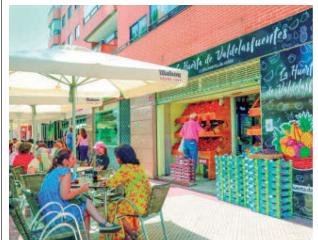
Esta línea está dotada con un millón de euros

El nuevo proyecto contempla la modificación del trazado del colector y para ello, cuenta con una inversión de 173.158,87 euros y un plazo estimado de ejecución de tres meses. Actualmente, la acometida de saneamiento del colector que discurre por la calle Facundo Navacerrada tiene problemas de desagüe, lo que provoca que durante episodios de lluvia se produzcan inundaciones en el interior del edificio. Además, el colector que desciende en sentido sur incorpora sus aguas al colector proyectado, con doble pozo.