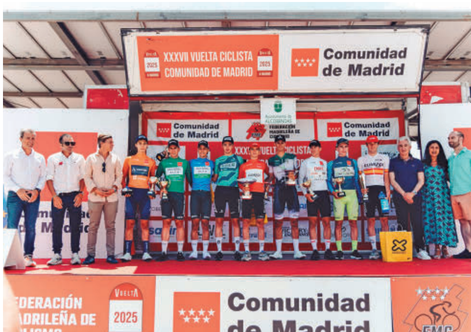
Podio final de la edición de 2025 FEDERACIÓN MADRILEÑA DE CICLISMO

Hasta 22 equipos estarán en el pelotón, incluyendo el Kelly Benefits de Estados Unidos, el Dovy Keukens-FCC From Roeselare de Bélgica o el Velo Performance de Irlanda. También habrá una nutrida presencia de filiales, como el Cortizo de Galicia, Finisher o el BBK Euskadi. Respecto a la Comunidad de Madrid, no faltarán El Bicho Plataforma Central Iberum y el Avimosa-El Anciano Rey de los Vinos.