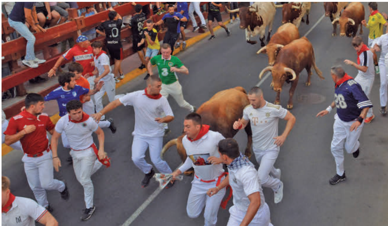
AYTO DE SS. REYES