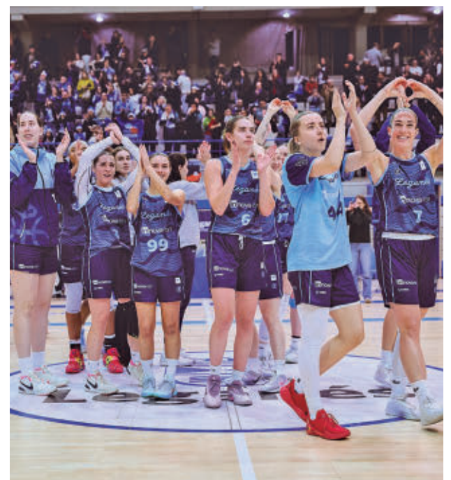
Nuevos retos para la plantilla pepinera