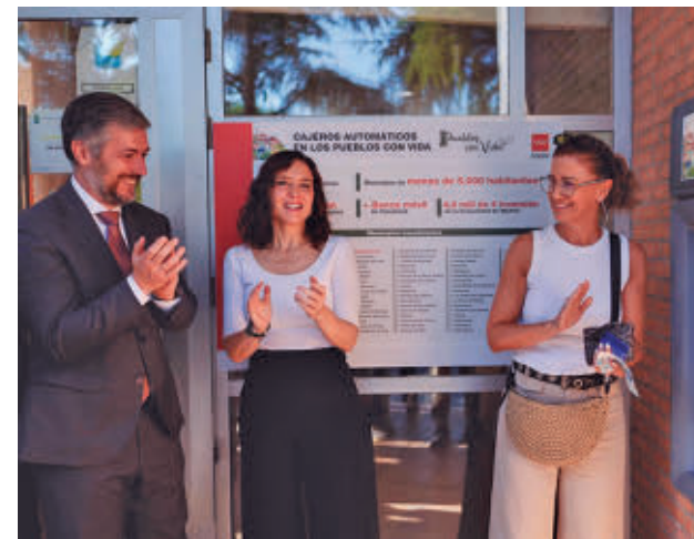
Ayuso inaugura el cajero de Batres

Los nuevos cajeros contarán con medidas de accesibilidad para garantizar su uso por personas con movilidad reducida y discapacidad visual. Para ello, estarán adaptados para usuarios en silla de ruedas e incorporarán menús con asistencia guiada por voz, conexión para auriculares y teclado en braille. Se podrá retirar efectivo sin pagar comisiones.