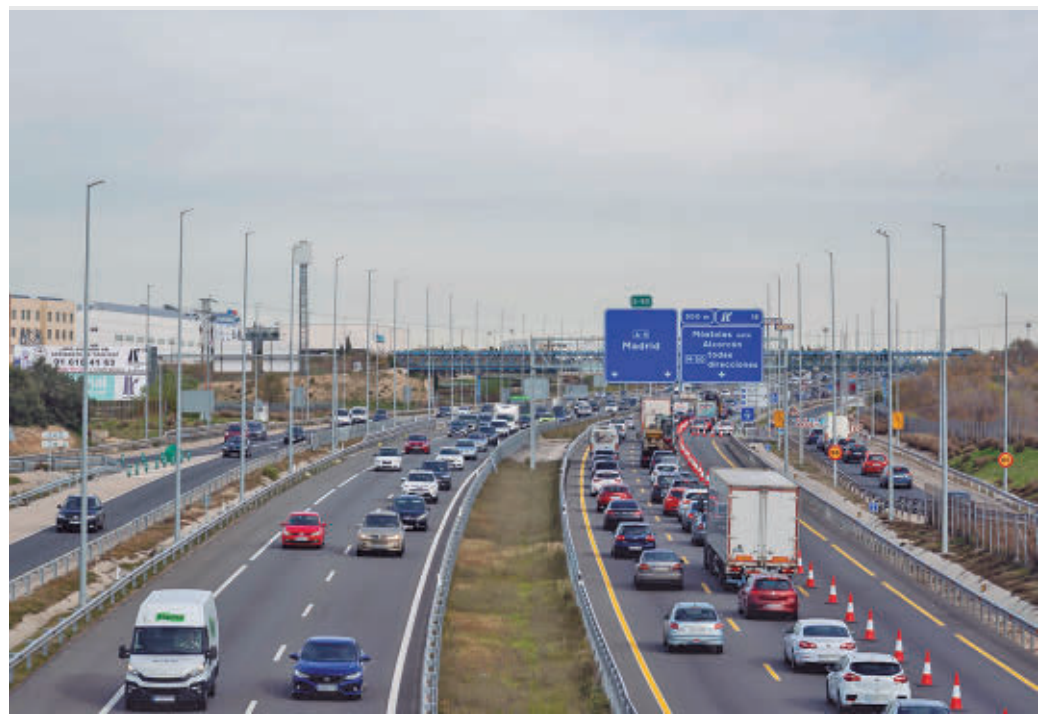
Los trabajos provocarán restricciones de tráfico en la A-5 durante julio y agosto

en diferentes tramos entre el 1 de julio y el 31 de agosto, "desde la madrugada de lunes hasta los viernes a mediodía". La intervención cuenta con un presupuesto de 15,4 millones de euros, y se enmarca dentro del programa estatal de conservación.