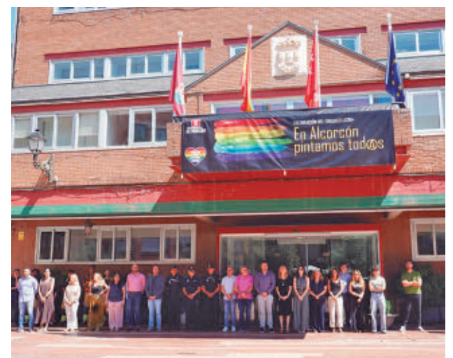
AYTO DE ALCORCÓN

El Ayuntamiento ha secundado la convocatoria para guardar un minuto de silencio en solidaridad con las víctimas y personas afectadas por el terremoto registrado en Venezuela. La iniciativa se ha sumado así a los gestos de apoyo institucional en recuerdo de los damnificados.