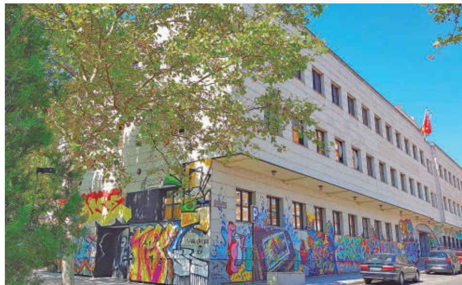
El Centro Joven será el espacio que acoja la programación de ocio juvenil AYTO DE ALCORCÓN

Las bibliotecas municipales volverán a desempeñar este verano una doble función: mantener el servicio habitual de préstamo y estudio y ofrecer espacios climatizados para afrontar las jornadas de más calor. La red reforzará además ese dispositivo con la apertura en agosto de la Biblioteca Ciudad de Nejapa, que se incorporará a las de Almodena Grandes y José Hierro, una más que el pasado verano. La concejal de Cultura, Miriam Benítez, ha explicado que la intención pasa por acercar a los vecinos "un hogar climático cerca de casa"