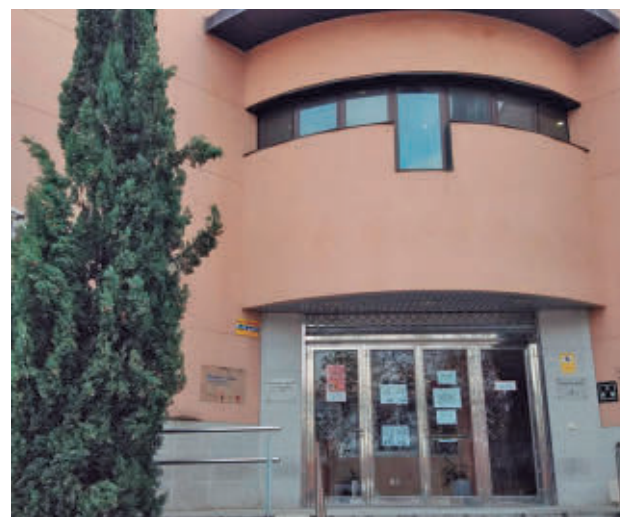
Ciudad de Nejapa se suma a la apertura veraniega CAM