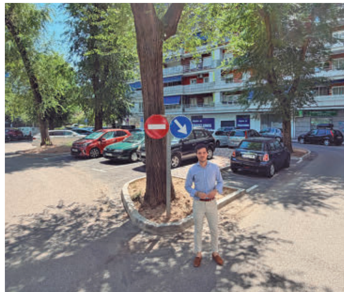
El alcalde acudió hasta la calle Brújula

Con el objetivo de embellecer y renaturalizar la ciudad, el Ayuntamiento de Torrejón ha plantado un olivo de 700 años en la rotonda próxima al Barrio del Castillo. A continuación, se han plantado otros seis olivos y otros 10 árboles que acompañarán a la palmera, el olmo y pino que ya existían en la rotonda más próxima al nuevo barrio de Aldovea. Por último, se ha construido un talud de 4.516 metros cuadrados de superficie.