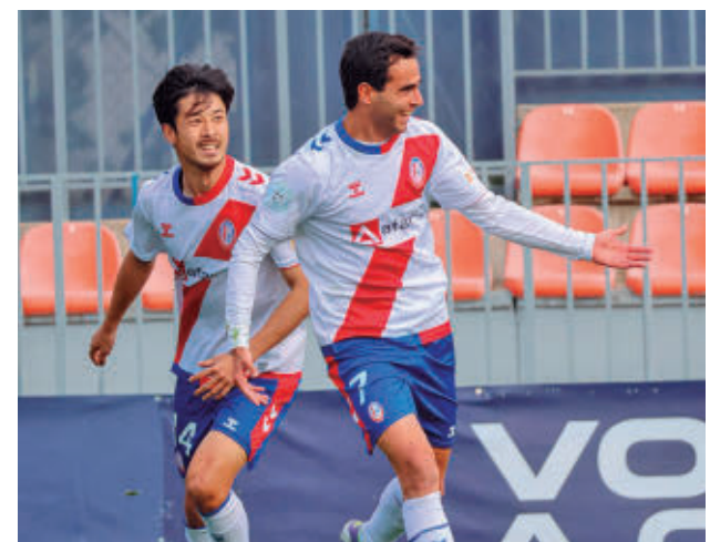
El Rayo logró el ascenso como campeón de grupo

La última jornada se jugará el 9 de mayo. Solo Getafe B y Alcalá serán locales.