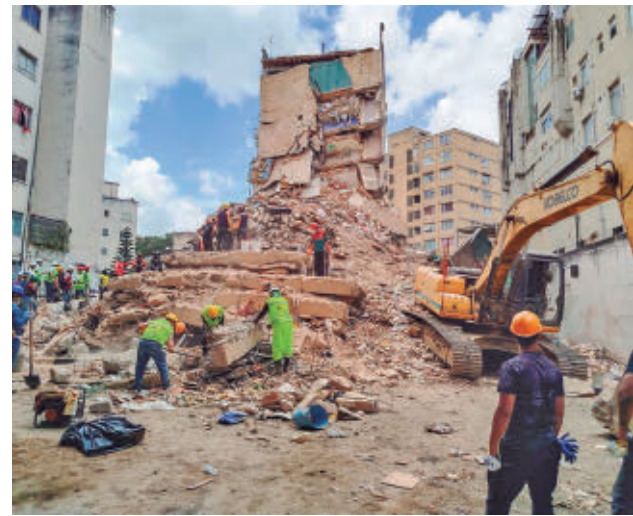
Una de las zonas afectadas por el terremoto