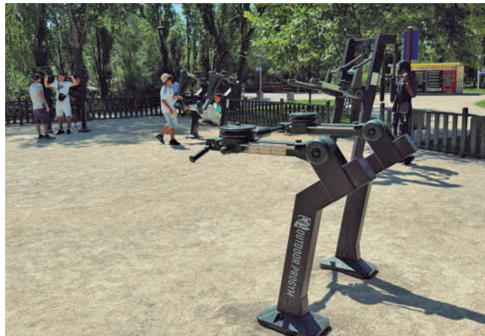
La nueva zona deportiva del Parque Europa

nes ubicado en la puerta de la Escuela Infantil JABY. También se han instalado dos bandas en el acceso al colegio de Educación Especial Iker Casillas y un doble resalte junto al paso de peatones de