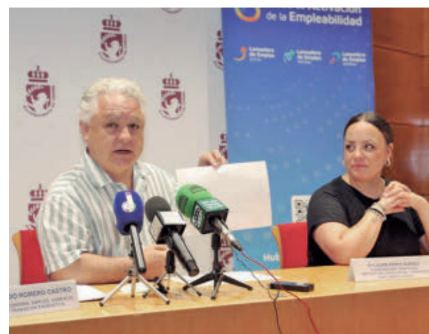
Presentación de las nuevas lanzaderas

Pueden participar personas de cualquier sector profesional o nivel educativo que residan en Coslada. Hay que apuntarse antes del 17 de agosto en el formulario que se encuentra online en la página web Hubempleabilidad.com/inscribete/ . Con