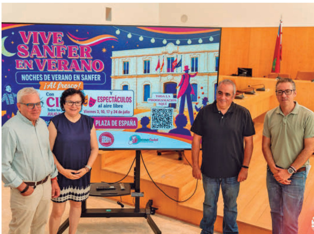
Presentación de la programación veraniega de San Fernando