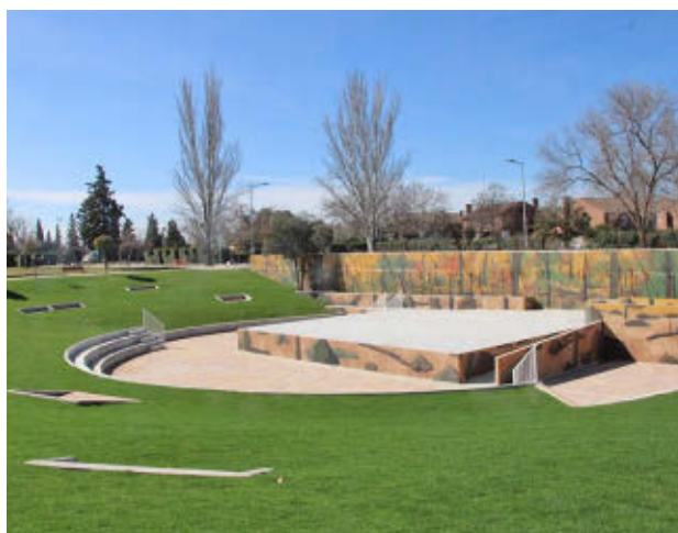
Parque 1º de Mayo de La Poveda

Todas las proyecciones comenzarán a las 22 horas, a excepción de 'La familia Benetón', cuyo inicio será a las 22:30 horas con motivo de las Fiestas del Carmen.