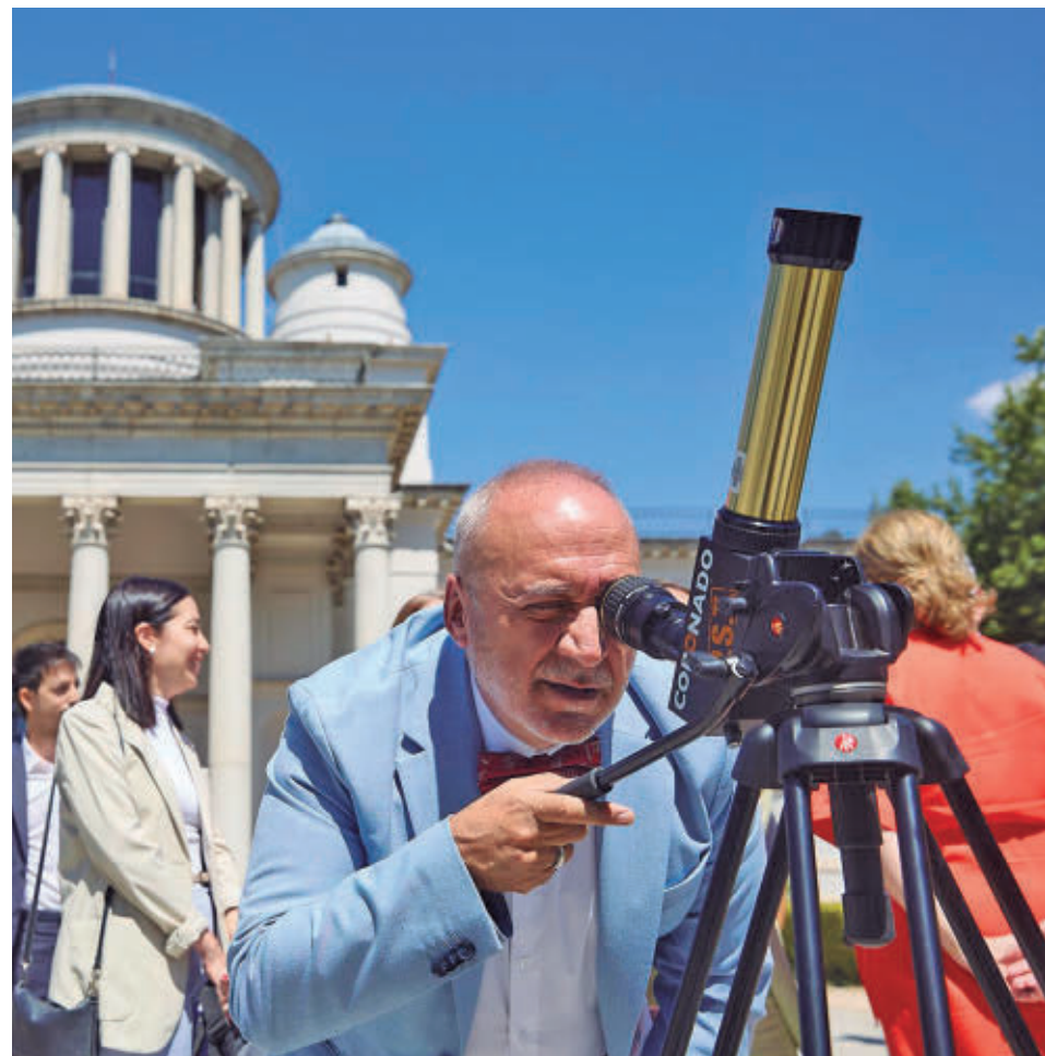
Una de las reuniones gubernamentales para hablar del eclipse total

La Comunitat Valenciana, la Comunidad de Madrid, Castilla y León y Aragón serán las regiones con mayor impacto económico previsto contribuyendo a la desestacionalización y el impulso del turismo rural. El informe des-