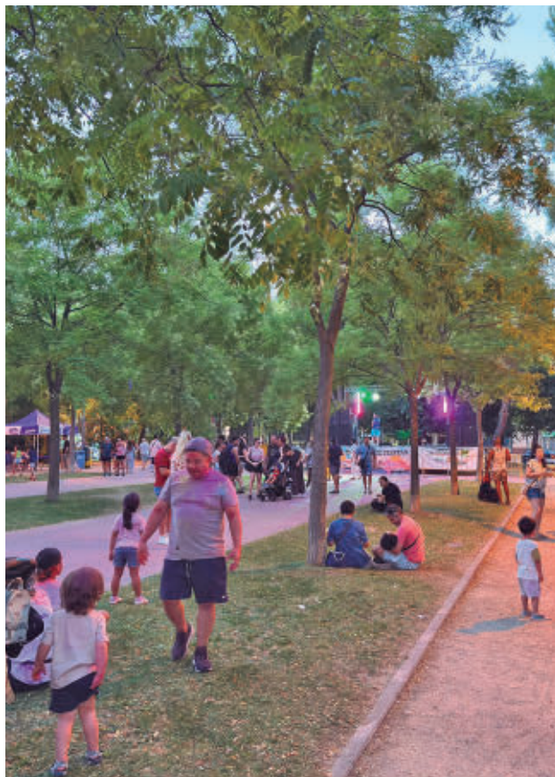
Otras fiestas de barrio celebradas en la ciudad AYTO DE GETAFE

EL CONCURSO DE TORTILLA COMPARTIRÁ PROTAGONISMO CON LA MÚSICA