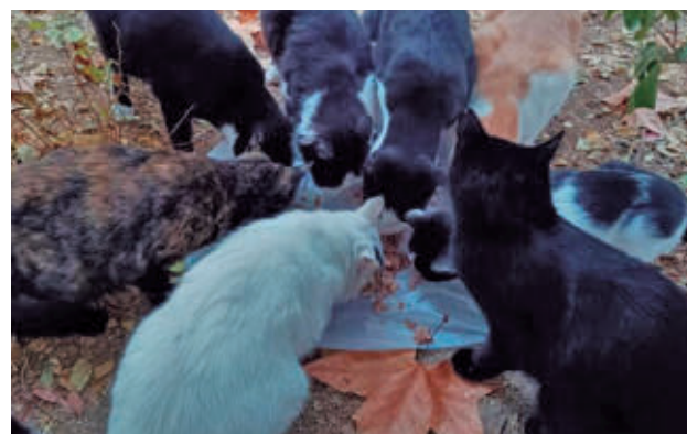
Una colonia de gatos AYTO DE GETAFE

La localidad tiene registrados 1.435 gatos distribuidos en 160 colonias, cuyos datos se recogen en una aplicación informática que permite geolocalizar cada encla-