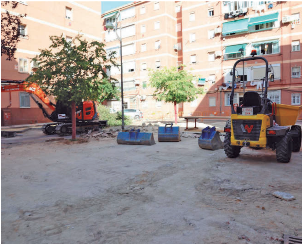
AYTO DE GETAFE