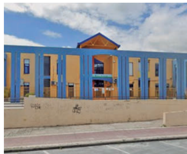
El centro renovará fachadas, cubiertas y ventanas este verano

El Summa 112 atendió a un hombre con quemaduras en el 20% del cuerpo, que fue trasladado en estado moderado al Hospital de Getafe, y también a una mujer con quemaduras leves en una mano, evacuada al mismo centro sanitario.