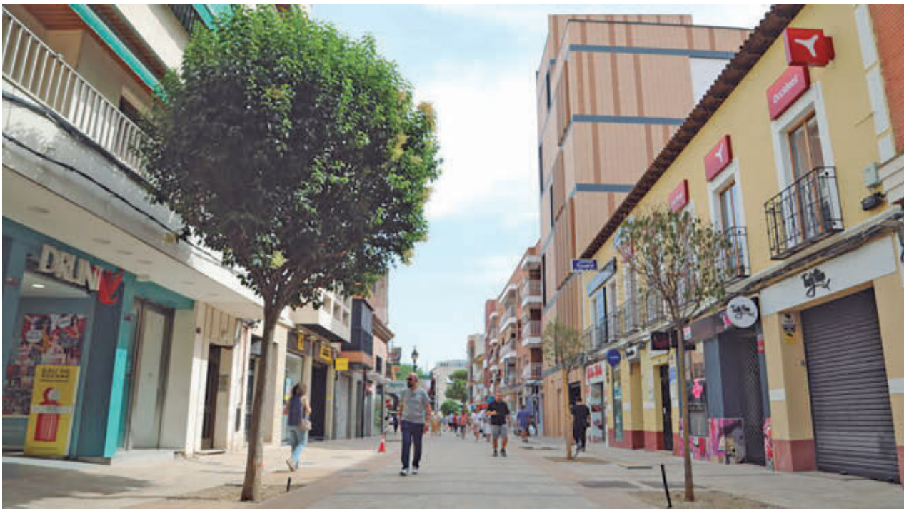
Dentro de la calle Madrid las obras avanzan hacia la calle Ricardo de la Vega AYTO DE GETAFE