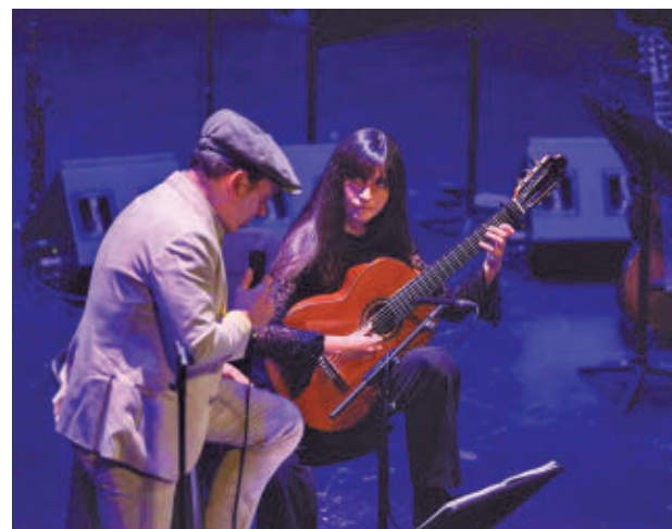
Actuación en directo de Zenet

'Bitelchús' (jueves 16) y Superman 2025' (jueves 23). La concejala de Cultura, Mercedes Neria, recordó que "en 2024 recuperamos unas Lunas del Egaleo que llevaban tres años sin celebrarse. Y ahora ofrecemos cultura de todos y para todos, porque es gratuito. Así que invito a todas las familias a ir y disfrutar las noches de julio en Leganés".