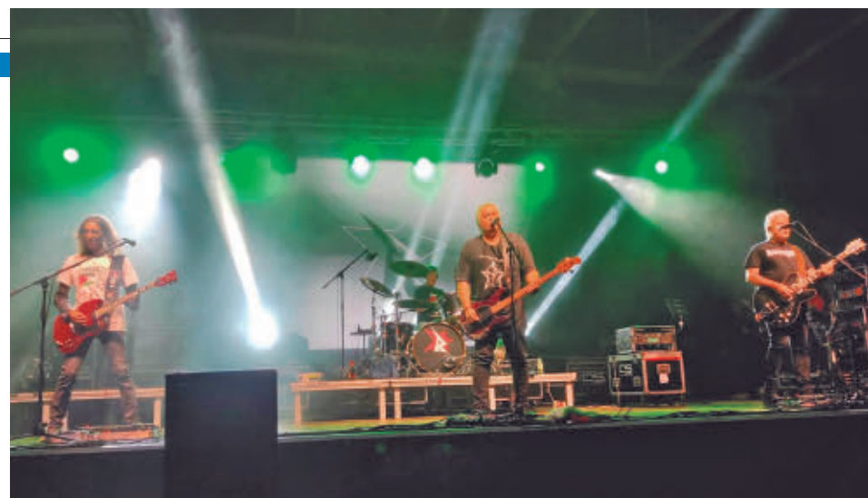
Concierto de la banda de rock Reincidentes

Pero la música no será la única apuesta de Las Lunas del Egaleo. El cine de verano se hace un hueco con películas como 'Minecraft' (jueves 9 de julio), la nueva versión de