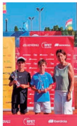
Recogida del trofeo