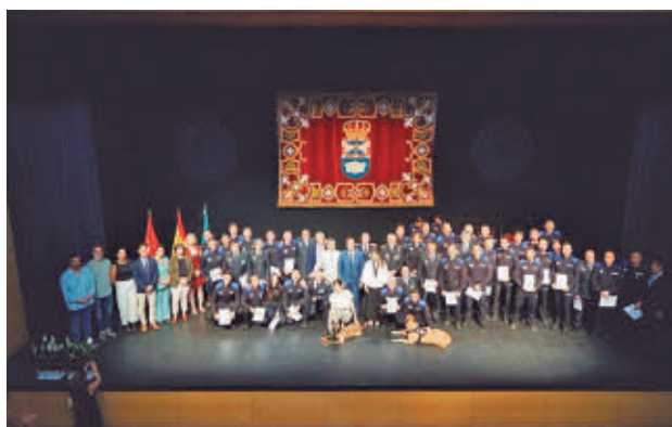
Foto de familia de los homenajeados

Entre las principales distinciones, el Consistorio ha