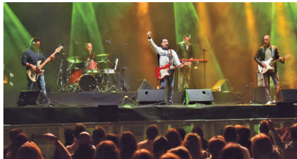
Modestia Aparte regresará a Leganés