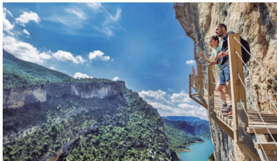
Uno de los miradores integrados en estas rutas para senderistas

20.000 kilómetros de senderos señalizados para su uso pedestre. Los hay para todos los niveles de dificultad, desde propuestas para disfrutar en familia hasta rutas pensadas para senderistas y al-