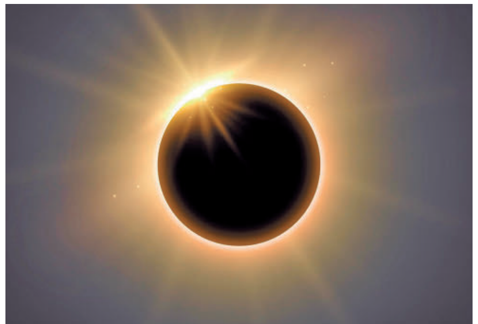
Así se verá el cielo durante la tarde del 12 de agosto

EL NIVEL DE GASTO ES ALTO ENTRE LOS 'CAZADORES DE ECLIPSES'