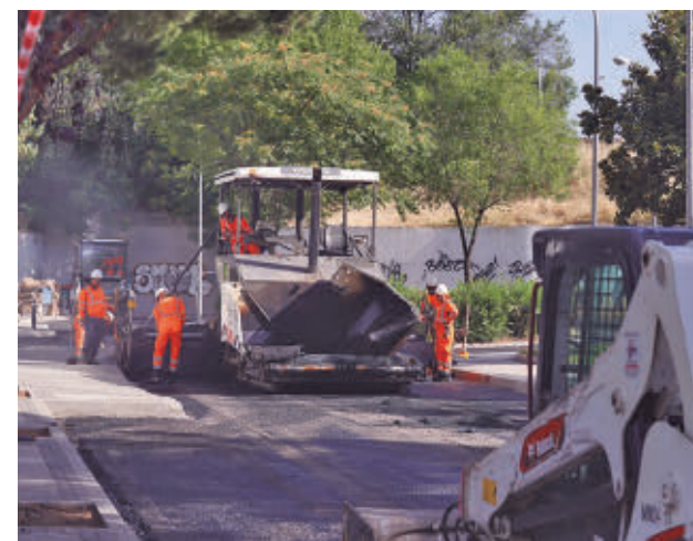
Labores de asfalto en la calle de Sangenjo

Una cuarta parte de la superficie a renovar, unos 292.500 metros cuadrados, se pavimentará con mezclas que contienen 54.700 neumáticos fuera de uso.