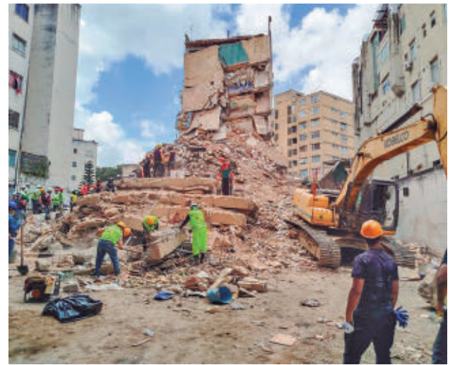
Zona afectada por el terremoto de Venezuela