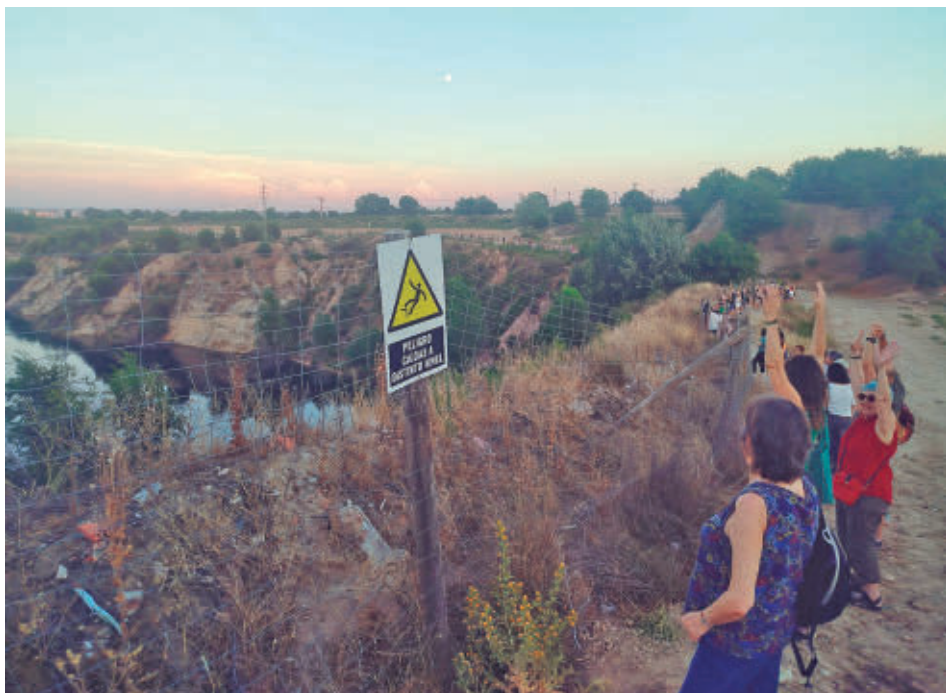
Ecologistas y vecinos se dieron la mano para 'abrazar' la laguna FRAVM