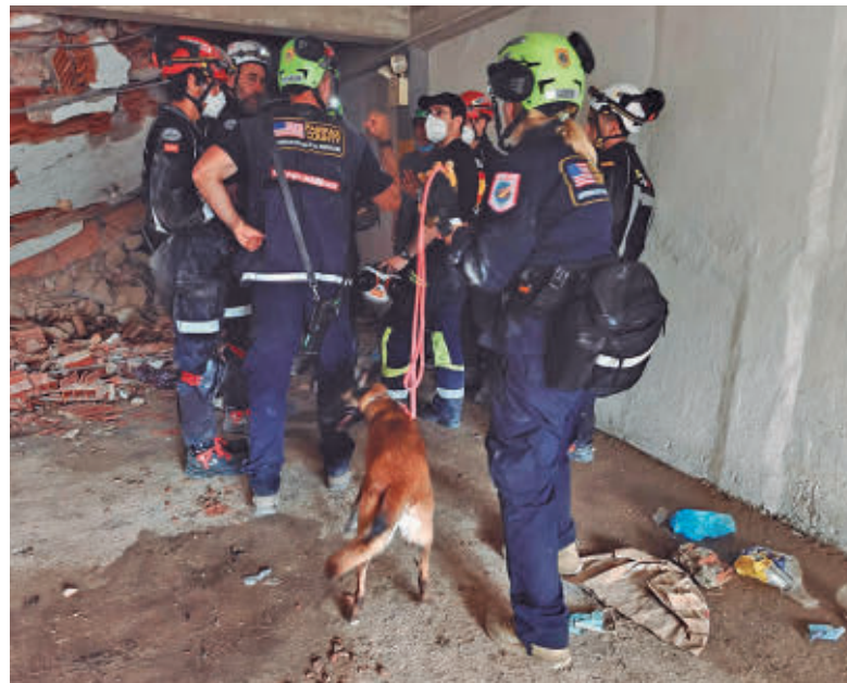
Un grupo de rescatistas en la zona del terremoto EMERGENCIAS 112

Misión Junto al resto de compañeros desplazados a la zona, estos