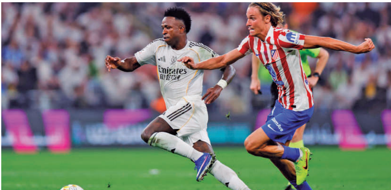
Vinicius y Marcos Llorente en un partido disputado en la pasada edición de la Supercopa