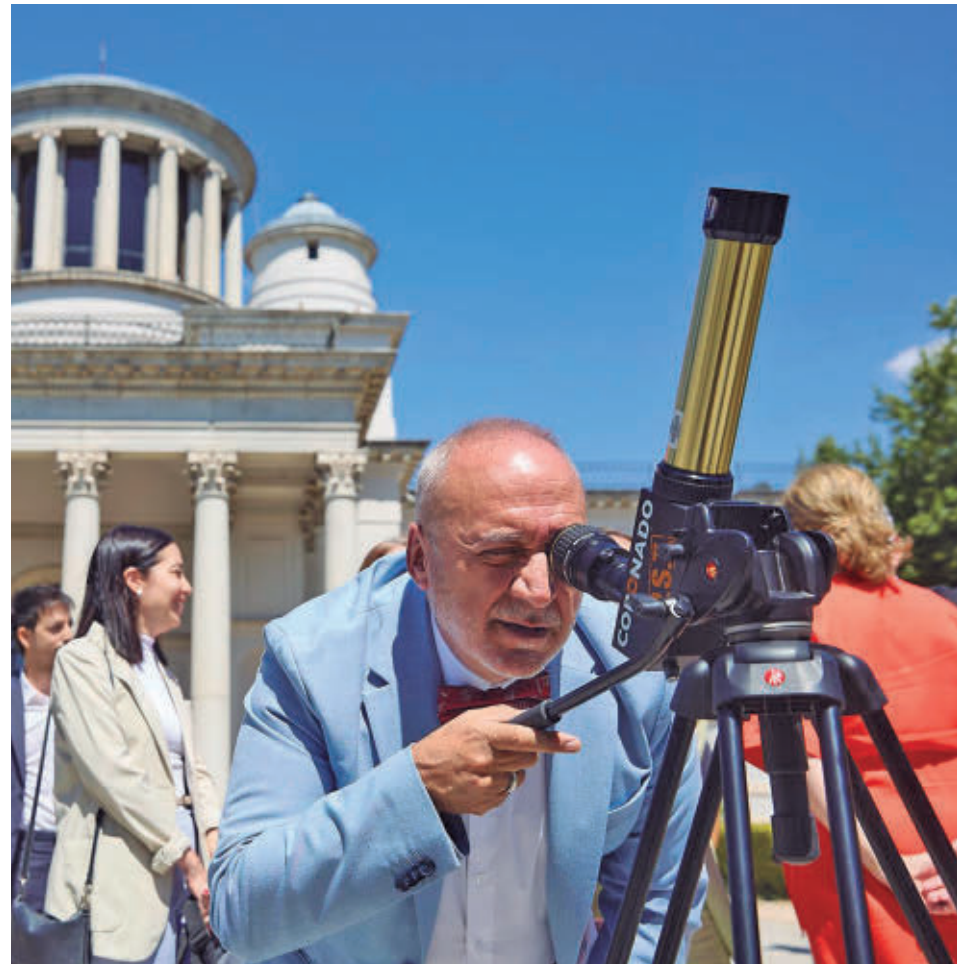
Una de las reuniones gubernamentales para hablar del eclipse total

Es la cantidad que recaudará el Estado en concepto de impuestos