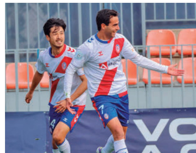
El Rayo logró el ascenso como campeón de grupo

La última jornada se jugará el 9 de mayo. Solo Getafe B y Alcalá serán locales.