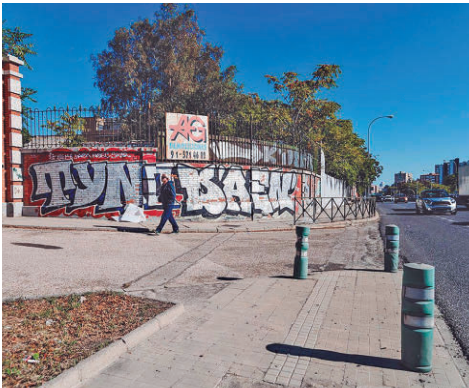
Parte de los terrenos incluidos en la futura Operación Campamento

Por último, el martes 7 se celebrará la misa en honor a San Fermín en el anfiteatro de la calle de Motril y la posterior procesión que pondrá el broche final a las fiestas.