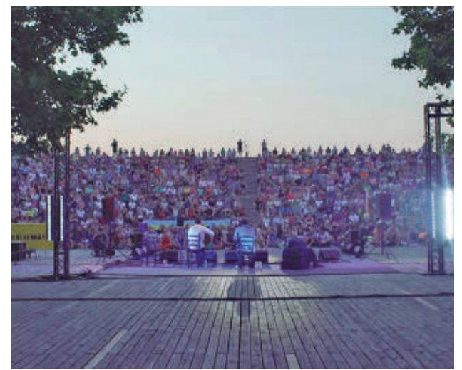
El auditorio del Parque Lineal será el epicentro de los festejos