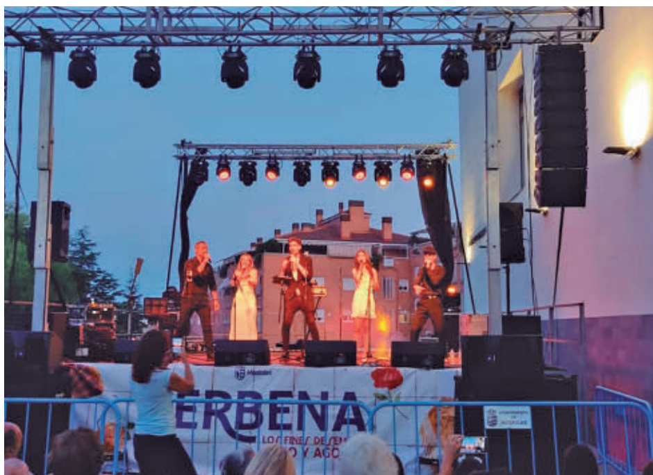
La programación para los fines de semana de verano arranca este primer fin de semana de julio

La programación continuará durante el verano con tributos dedicados a Joaquín