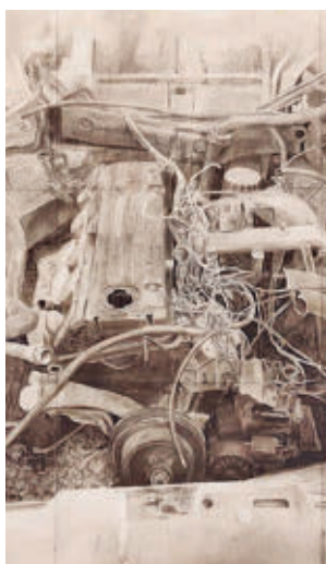
En el Museo de la Ciudad