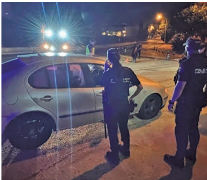
Detenidos tras robar en un bar en Móstoles y huir de la Policía Nacional

● Terminaron chocando a gran velocidad contra un guardarraíl en la zona de O'Donnell y un agente de la Policía resultó herido