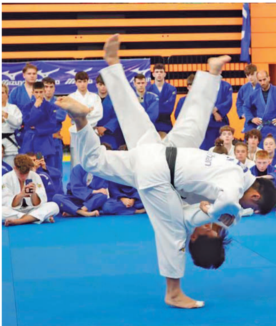
Móstoles acogerá este stage, que reunirá 450 deportistas nacionales e internacionales

Además, el evento tendrá un impacto económico para la ciudad, especialmente en los sectores hotelero, hostelero y comercial, gracias a la llegada de cientos de deportistas, técnicos y familiares