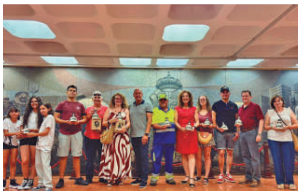
Los ganadores que participaron en el concurso

Por segundo año consecutivo, el municipio exhibió cinco Meninas Goyescas de gran formato, decoradas de manera personalizada, que