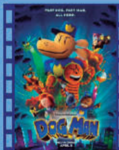
DOG MAN 20 de julio