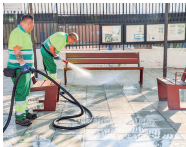
Operarios realizando la limpieza

Católicos, Cristóbal Colón y Alonso de Ojeda. Los trabajos que se realizan incluyen barrido y baldeo, baldeo mixto, barrido y baldeo mecánico de aceras, limpieza a presión sobre manchas localizadas o limpiezas manuales para eliminar chicles. Se hacen con agua, jabón e hipoclorito. También se están acondicionando los macizos y alcorques.