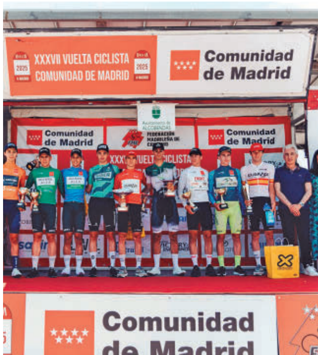
Podio final de la edición de 2025 FEDERACIÓN MADRILEÑA DE CICLISMO

Julio es un mes que destila ciclismo por los cuatro costados, y no hablamos solo del Tour de Francia. El próximo martes 7 de julio arrancará una cita que va ganando arraigo en el calendario, la Vuelta Ciclista a la Comunidad de Madrid en categoría sub-23. La etapa inaugural tendrá a la localidad de Móstoles como salida y meta. En