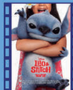
LILO & STITCH 6 de julio