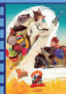
THE BAD GUYS 2 13 de julio