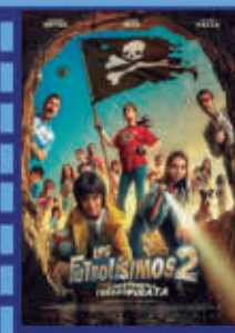
LOS FUTBOLÍSIMOS 2. EL MISTERIO DEL TESORO PIRATA 27 de julio