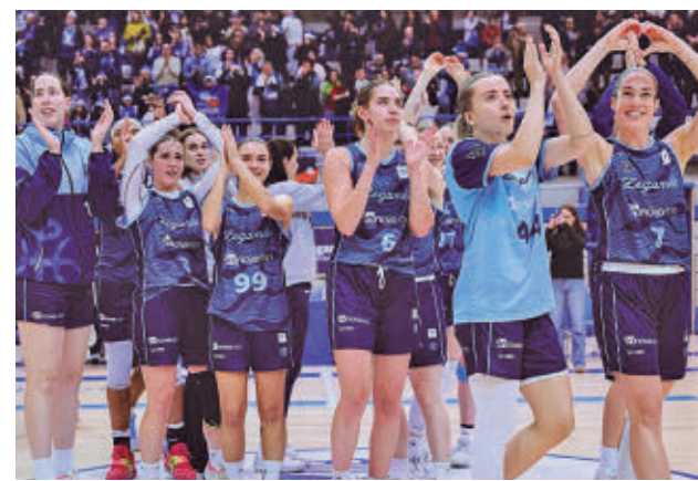
Pie de foto FIRMA FOTO / GENTE

Las incógnitas que quedaran a esas alturas de competición podrían comenzar a disiparse en la penúltima etapa. El viernes 10 el pelotón saldrá de la plaza de la Constitución de Galapagar para cubrir un recorrido de 150 kilómetros salpicados con los puertos de la Cruz Verde (en dos ocasiones), Santa María de la Alameda y Robledondo como cribas de cara a la meta situada en San Lorenzo de El Escorial. Después de una dura jornada exigente con perfil montañoso, los especialistas en la lucha contra el crono tendrán su oportunidad en una etapa de 11,5 kilómetros que discurrirá por las calles de Alcobendas, donde se instalará el podio final.