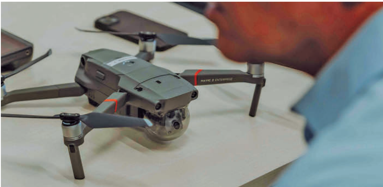
Uno de los drones que está utilizando la Policía Local de Las Rozas