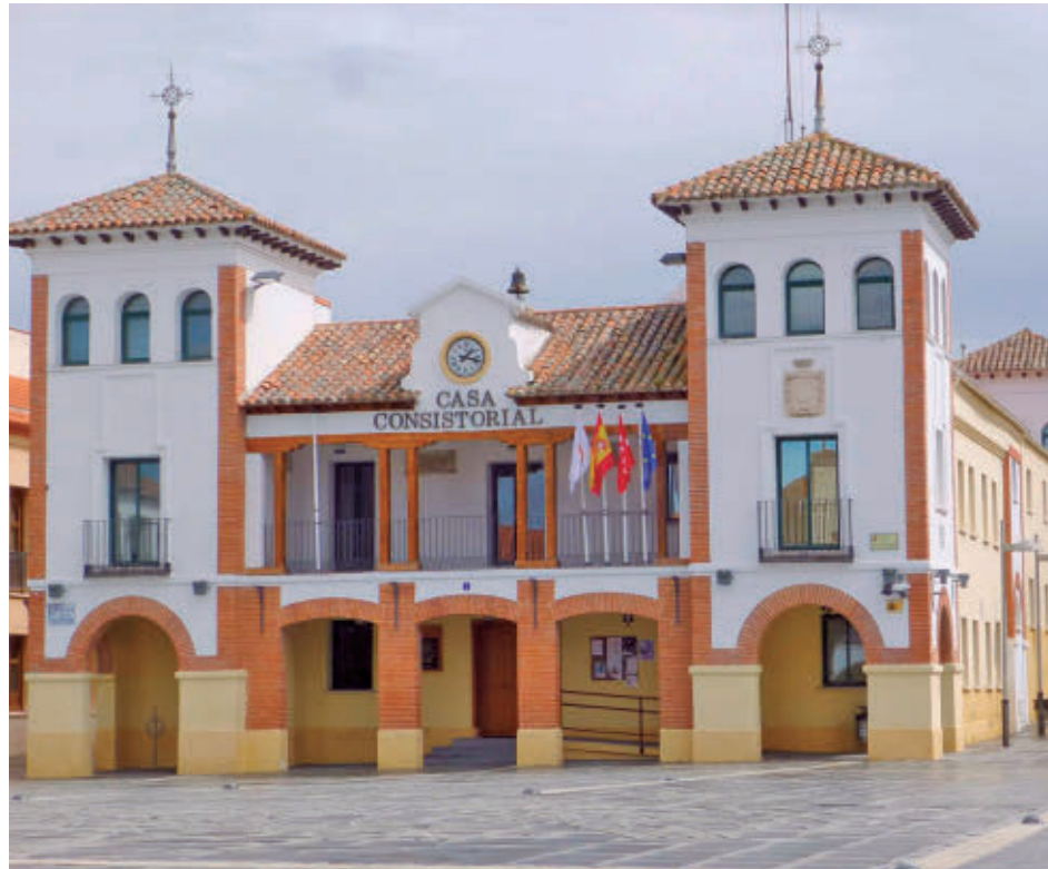
Ayuntamiento de Pinto

Conforme al Plan General de Ordenación Urbana (PGOU) de Pinto, el uso principal que corresponde en este inmueble es el de residencial unifamiliar, si bien se admite su compatibilidad con el uso residencias en su categoría 1ª, destinada a pequeñas residencias cuando el número de habitaciones para residentes sea inferior o igual a 10 unidades. También contempla los subtipos 2 y 3 en lo referido a centros de acogida o residenciales de atención social. Para estos tres casos, se