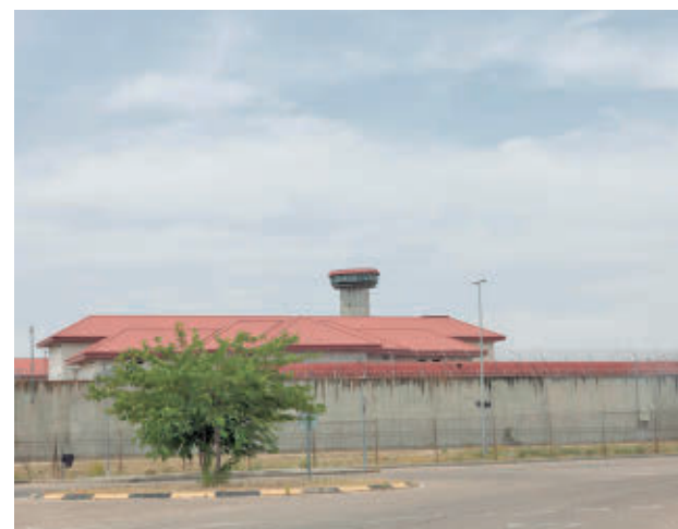
Prisión de Valdemoro E. P.

El sindicato ha recordado que el pasado 14 de junio se presentó una reclamación solicitando el traslado de un interno que había agredido a una trabajadora en el Departamento de Enfermería de Valdemoro. El preso en cuestión presenta un perfil “de extrema peligrosidad” y acumula varios incidentes graves