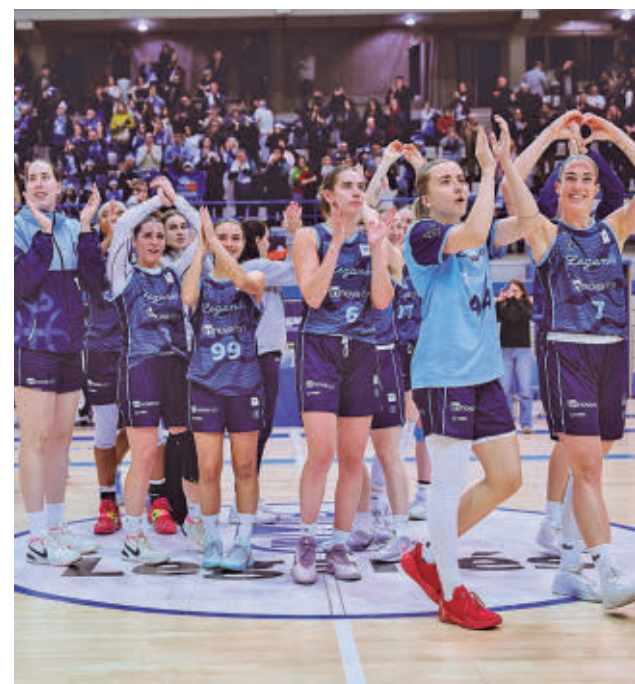
Nuevos retos para la plantilla pepinera