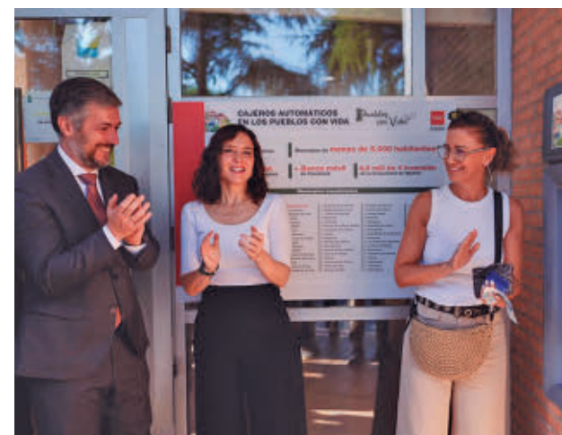
Ayuso inaugura el cajero de Batres

Los nuevos cajeros contarán con medidas de accesibilidad para garantizar su uso por personas con movilidad reducida y discapacidad visual. Para ello, estarán adaptados para usuarios en silla de ruedas e incorporarán menús con asistencia guiada por voz, conexión para auriculares y teclado en braille. Se podrá retirar efectivo sin pagar comisiones.