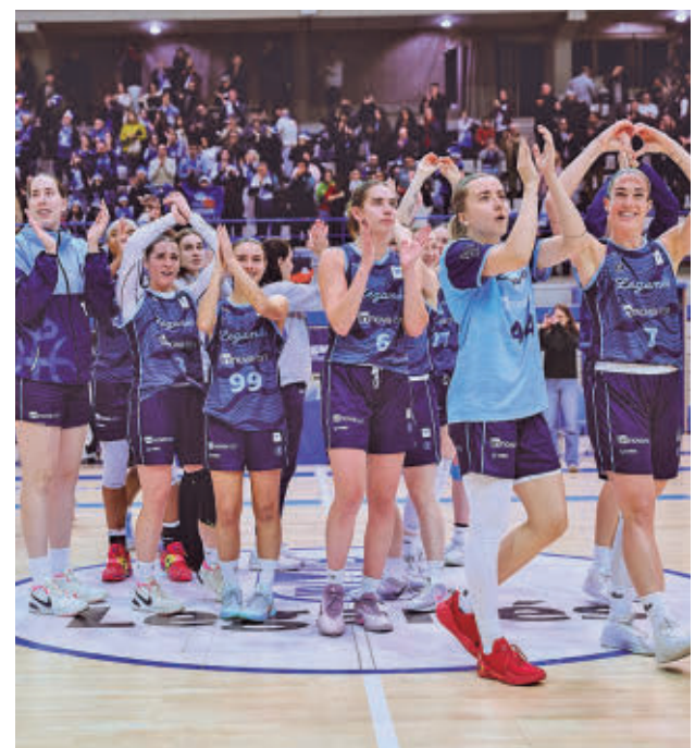
Nuevos retos para la plantilla pepinera