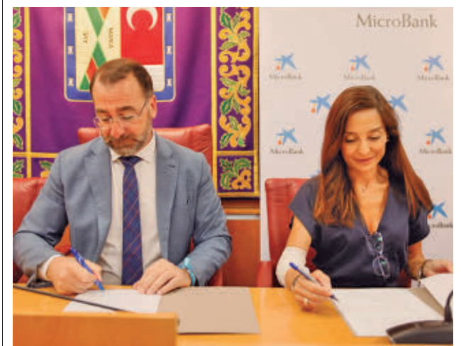
Firma del acuerdo AYUNTAMIENTO DE COLMENAR VIEJO

Los hechos se produjeron el pasado 25 de junio, cuando se recibió el aviso de este vecino, que advirtió de la presencia de tres personas que merodeaban las inmediaciones de un edificio de la localidad. Una vez en el lugar, ambos Cuerpos trataron de identificar a los sospechosos, encontrando entre sus pertenencias varias láminas finas de metal dobladas, perfiles de llaves sin mecanizar y útiles de percusión para llaves, todo ello compatible con las llaves para forzar cerraduras mediante el método de impresión.