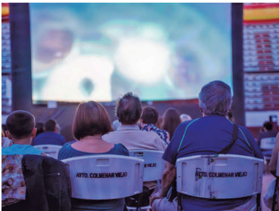
Una propuesta cultural para las noches estivales