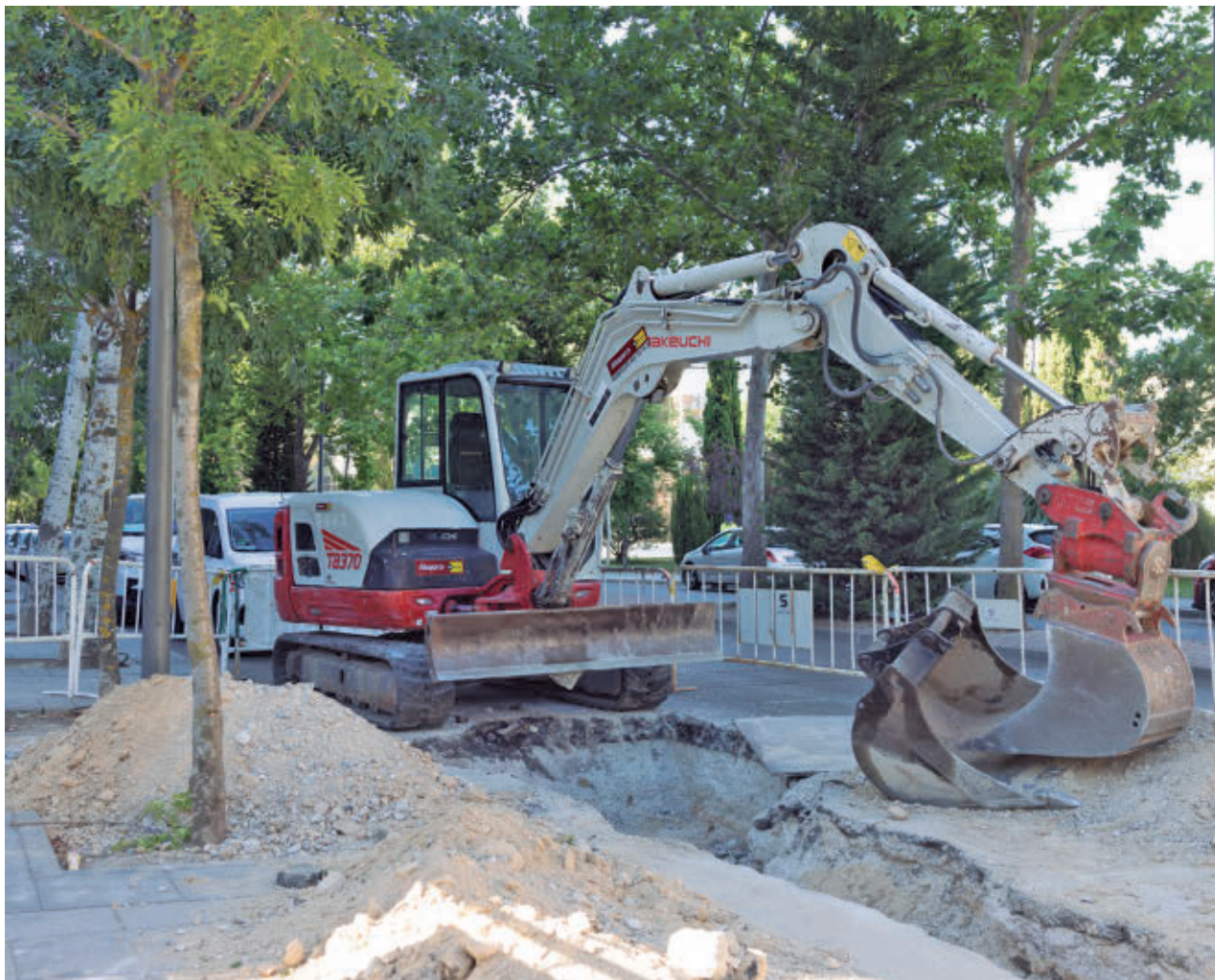
AYTO DE TRES CANTOS