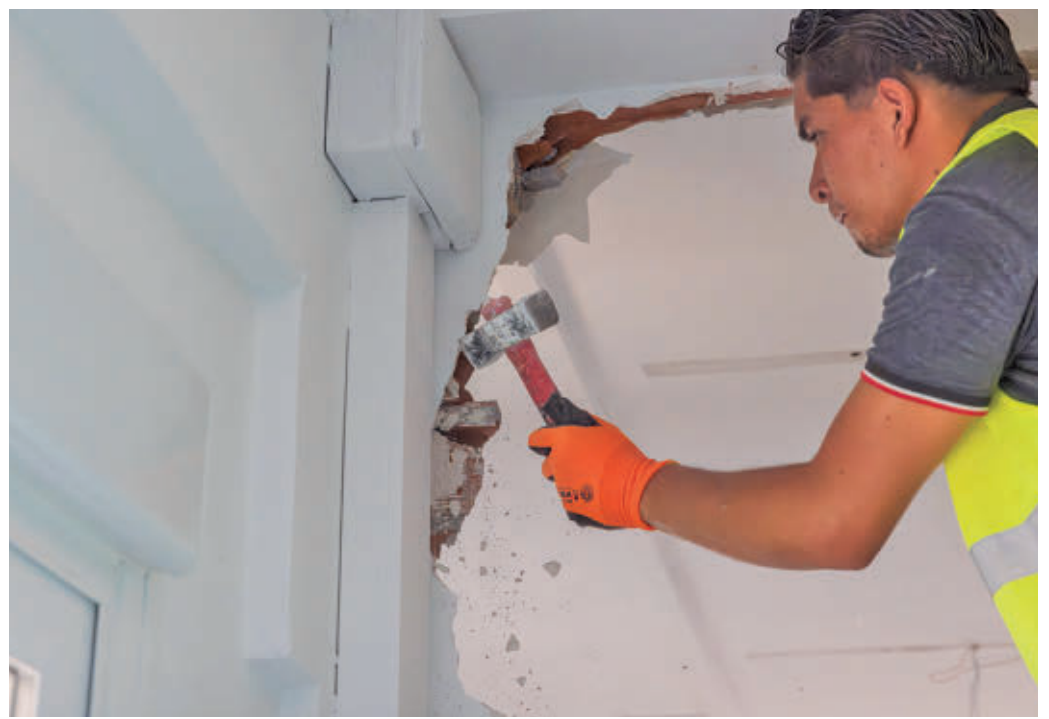
Ya han arrancado los trabajos de acondicionamiento en varios colegios públicos AYTO DE TRES CANTOS

Por otro lado, las familias tricantinas volverán a contar