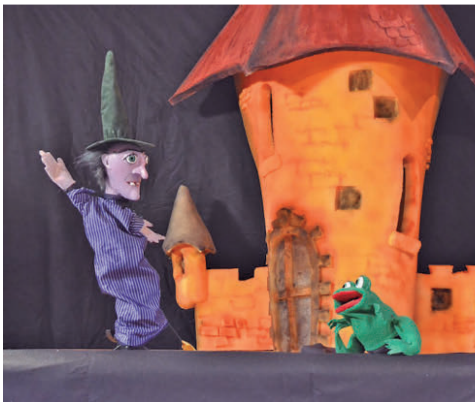
El público familiar podrá disfrutar de Verbena infantil en la Plaza del Sol

El ciclo continuará durante agosto con 'Un lobo en los cuentos', de Títeres Los Gorriones, el día 2; la versión de 'Blancanieves', a cargo de Tropos Teatro de Títeres, el 9 de agosto; 'Cuéntame un cuento', nuevamente con Títeres Los Gorriones, el día 16; y concluirá el 23 de agosto con 'Los músicos de Bremen', una representación de El Retablo de la Ventana.