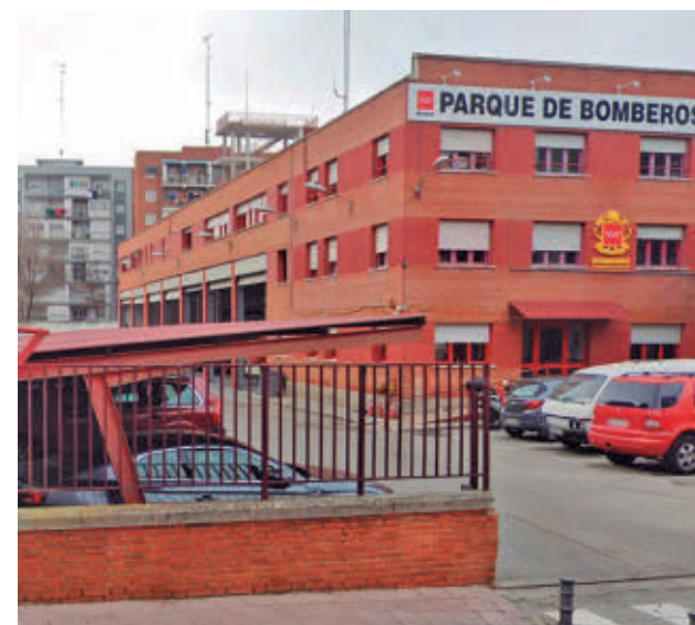
Prestará servicio a Móstoles y a localidades del eje de la A-5

El proyecto fue abordado durante un encuentro entre el al-