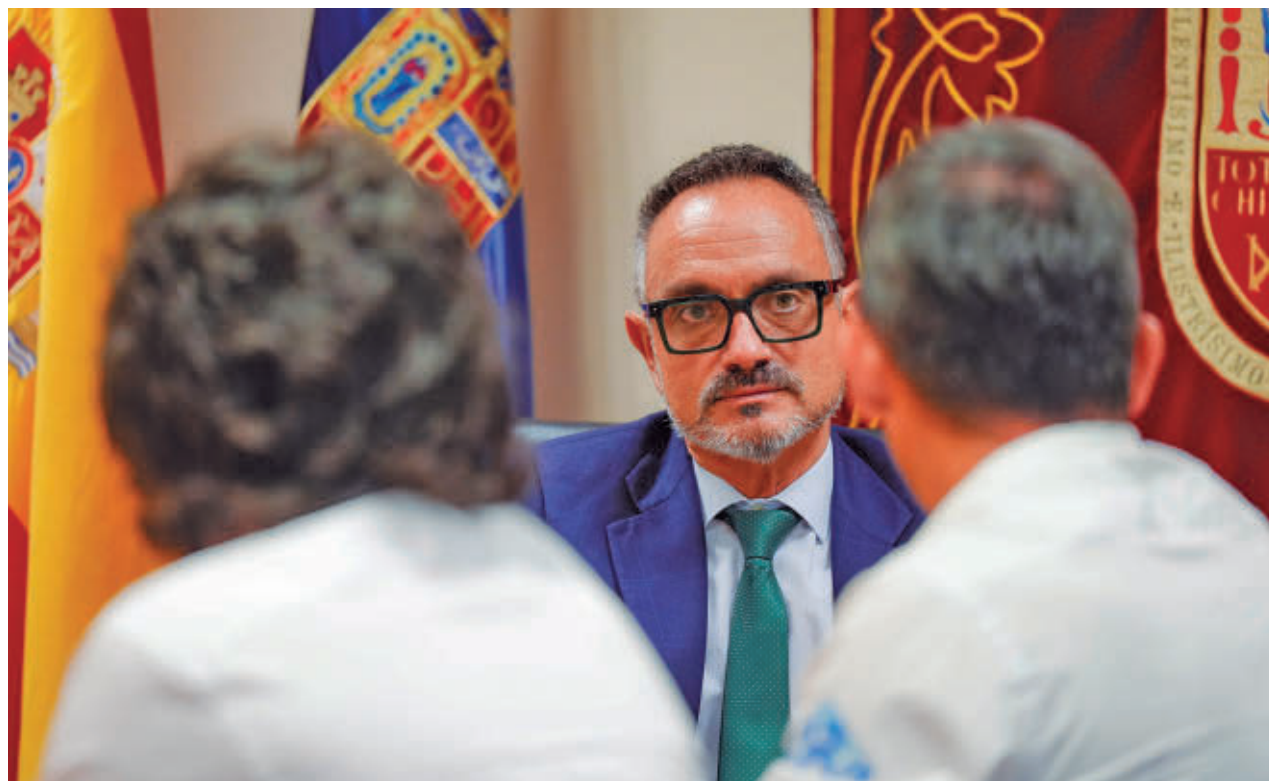
El alcalde de Móstoles apela la admisión de la querrela por presunto acoso sexual y laboral a una exconcejal del PP

En el auto que ahora ha sido recurrido ante la Audiencia Provincial, la magistrada Lourdes Ramírez Castro confirma íntegramente la resolución dictada inicialmente el 15 de abril, en la que se acordaba la incoación de diligencias previas y la práctica de diversas actuaciones, entre ellas la declaración de la querellante.