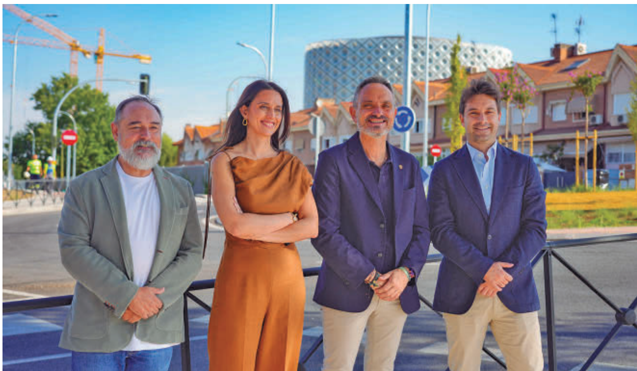
AYTO DE MÓSTOLES