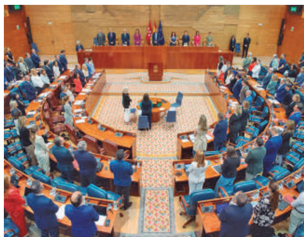
Asamblea de Madrid

ceso de trabajo. De hecho, imperpeló directamente a la presidenta de la Comunidad de Madrid, Isabel Díaz Ayuso, a quien pidió "dar un paso adelante frente al machismo". "No quisieron participar en la fase previa; ahora es imprescindible que sumen propuestas, esfuerzos y contribuyan directamente en el desarrollo y ejecución del plan contra la violencia sexual", puntualizó.