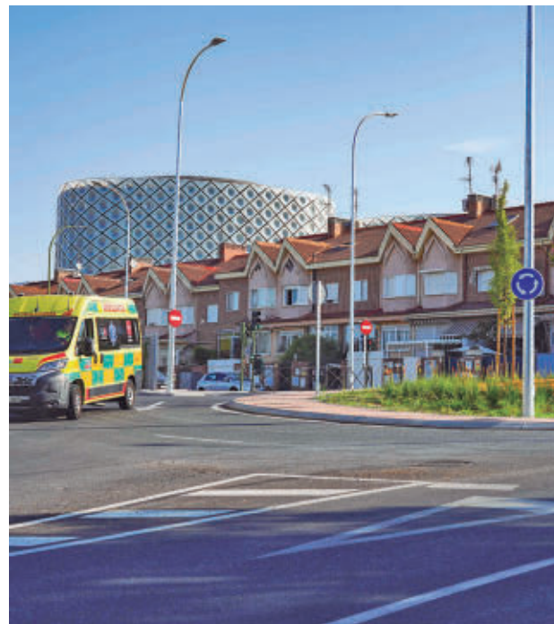
Nuevo acceso Sur en la calle Tulipán, junto a la calle Gardenia

El nuevo vial, de unos 150 metros de longitud, conecta la calle Tulipán con el complejo hospitalario y evita a mu-