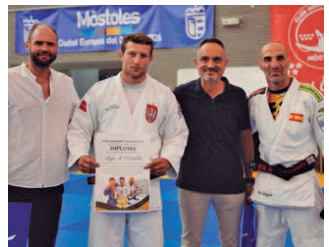
450 judocas en un entorno de alto nivel técnico y formativo

La celebración del Stage Judo Madrid 'Villa de Móstoles', organizado por la Asociación Judo Móstoles, en colaboración con el Ayuntamiento, a través de la concejalía de Deportes y Sanidad, consolida a Móstoles como Ciudad Europea del Deporte 2026.