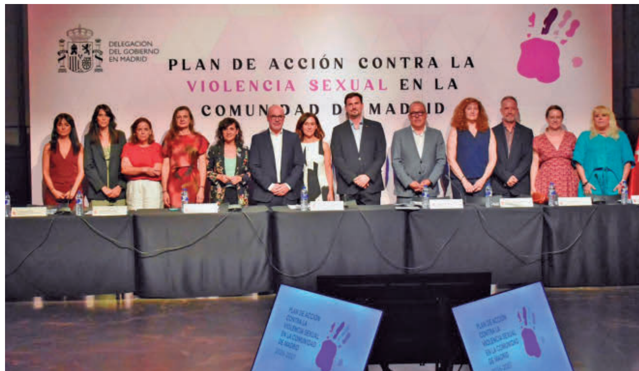
Presentación del plan de la Delegación del Gobierno en Madrid contra la violencia sexual

Contempla medidas como campañas sobre el consentimiento, una estrategia contra la misoginia en las redes sociales, la obligatoriedad de realizar sesiones sobre igualdad en los centros educativos o formación a docentes y familias