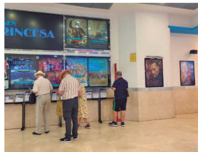
Espectadores mayores acuden al cine

Los reclamos para la jornada del sábado 11 son, entre otros, Nick Cave & The Bad Seeds, con actuación prevista a las 22 horas en el escenario principal Region of Madrid. Ese mismo espacio acogerá también a Jalen Ngonda, The Black Crowes y Pulp. Kasabian y David Byrne pasarán por el escenario Orange. La organización recomienda acudir al festival en transporte público, a través de Metro, Cercanías o autobús.