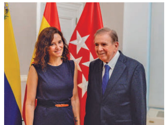
Isabel Díaz Ayuso y Edmundo González Urrutia

La presidenta de la Comunidad de Madrid, Isabel Díaz Ayuso, realizó el anuncio el martes 7 de julio durante el recibimiento de Ayuso al presidente electo venezolano, Edmundo González Urrutia, en la Real Casa de Correos. Ese mismo día se realizó un acto de homenaje a los más de 3.000 fallecidos.