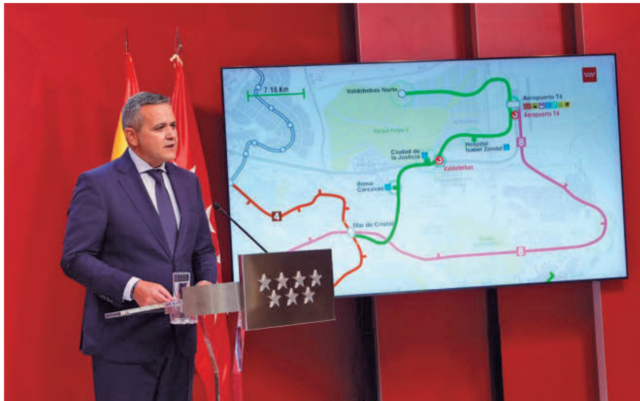
El consejero de Transportes presentó la ampliación al norte de la Línea 11

El recorrido proseguirá hacia la estación Hospital Enfermera Isabel Zendal, facilitando el acceso al complejo hospitalario y a toda su área de influencia, para continuar después hasta la estación de Metro de la T4, reforzando el enlace con el aeropuerto Adolfo Suárez Madrid-Barajas y los futuros ámbitos de