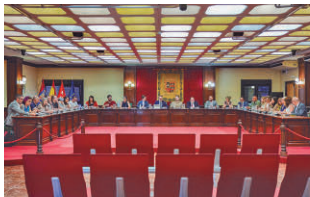
Sigue el compromiso de tener la deuda municipal en 0 euros

municipales, con especial incidencia en urbanismo, seguridad, educación y modernización de los servicios públicos. La propuesta salió adelante con los votos favorables del PP y del concejal no adscrito, el rechazo del PSOE y del Grupo Mixto y la abstención de Más Madrid y Vox.