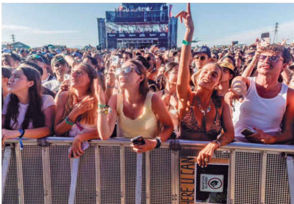
Uno de los conciertos celebrados durante la edición de 2025

» Viernes 10 y sábado 11, 22 horas. Parque Central. Acceso libre