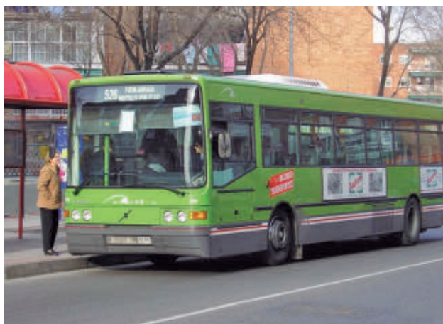
Ubicada frente a la residencia de mayores Las Camelias